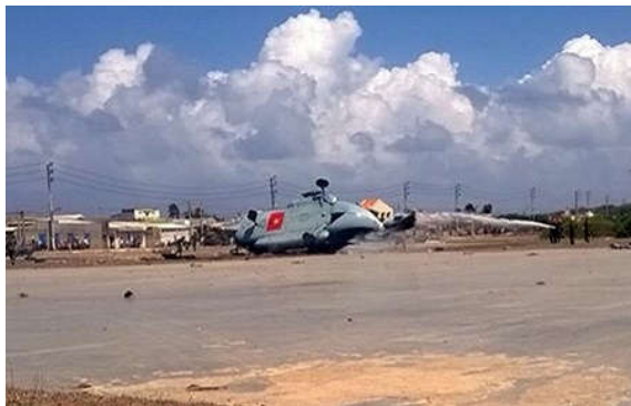
Ảnh hiện trường máy bay rơi.

Được biết vào sáng cùng ngày chiếc trực thăng M18 xuất phát từ sân bay Thành Sơn (Ninh Thuận). Đây là chuyến bay định kỳ trực cứu hộ cứu nạn thường xuyên và trên máy bay ngoài tổ lái ba người còn có năm người nằm trong tổ trực tìm kiếm, cứu nạn trên biển.