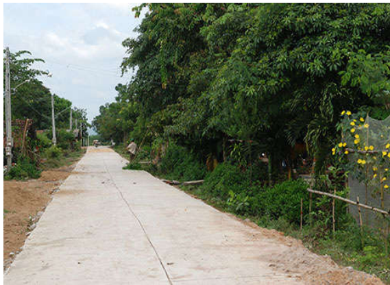
Đường giao thông nông thôn ở xã Mê Pu.

Sáng 27/3, UBND tỉnh Bình Thuận tổ chức hội nghị triển khai chương trình mục tiêu quốc gia xây dựng nông thôn mới năm 2015 và công bố 8 xã đạt chuẩn nông thôn mới đầu tiên trên địa bàn tỉnh gồm: Hàm Trí (huyện Hàm Thuận Bắc), Thiện Nghiệp (Tp. Phan Thiết), Hàm Minh (huyện Hàm Thuận Nam), Nghị Đức (huyện Tánh Linh), Tam Thanh (huyện đảo Phú Quý) và 3 xã Sùng Nhơn, Đức Hạnh, Mê Pu (huyện Đức Linh).