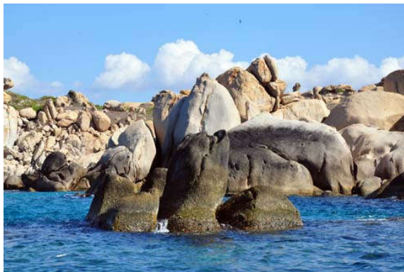
Nhiều khối đá với những hình thù khác nhau tạo sự liên tưởng cho người tham quan.

Tuấn Anh // http://www.qdnd.vn/ .- 2015 (ngày 3 tháng 3)