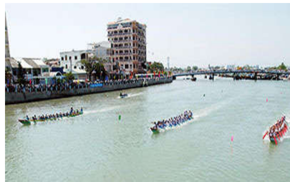
Lễ hội đua thuyền, một trong những sản phẩm du lịch được du khách yêu thích ở Bình Thuận.

đồng, tăng 17,8%. Bình Thuận trở thành một trong những điểm sáng về du lịch của Việt Nam.