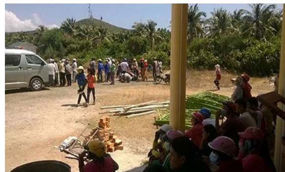
Đông đảo người dân đến hiện trường xem máy bay rơi.

Trên máy bay ngoài phi công còn có tám hành khách. Khi máy bay hạ độ cao để chuẩn bị hạ cánh đáp xuống sân bay Phú Quý thuộc xã Ngũ Phụng thì bất ngờ gặp sự cố kỹ thuật.