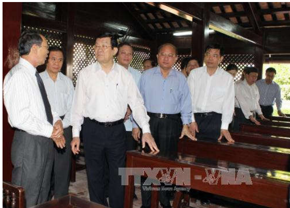
Chủ tịch nước đến thăm nơi Bác Hồ từng dạy học ở Khu Di tích Trường Dục Thanh, thành phố Phan Thiết.

Nhấn mạnh năm 2015, là năm có nhiều sự kiện đặc biệt, Chủ tịch nước đề nghị để chuẩn bị cho Đại hội Đảng các cấp, Bình Thuận cần phải nhìn thẳng vào sự thật, để giải bài toán phát triển; đoàn kết, nỗ lực hoàn thành nhiệm vụ của năm cuối nhiệm kỳ, đồng thời thảo luận kỹ, đóng góp ý kiến xác đáng cho dự thảo Báo cáo chính trị tiến tới Đại hội Đảng toàn quốc lần thứ XII nhằm tạo tiền đề vững chắc cho nhiệm kỳ mới.