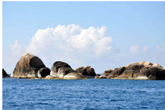
Cù Lao Câu ngày càng được nhiều du khách biết đến nhờ vẻ đẹp hoang sơ.