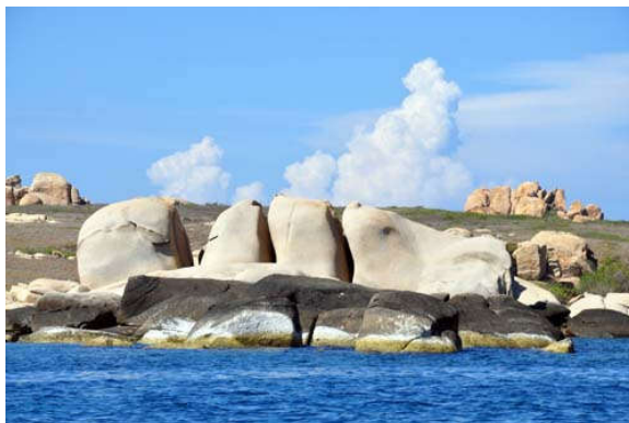
Cù Lao Câu hấp dẫn ở vẻ hoang sơ và kỳ ảo của đá.

Tuấn Anh // http://www.qdnd.vn/ .- 2015 (ngày 3 tháng 3)