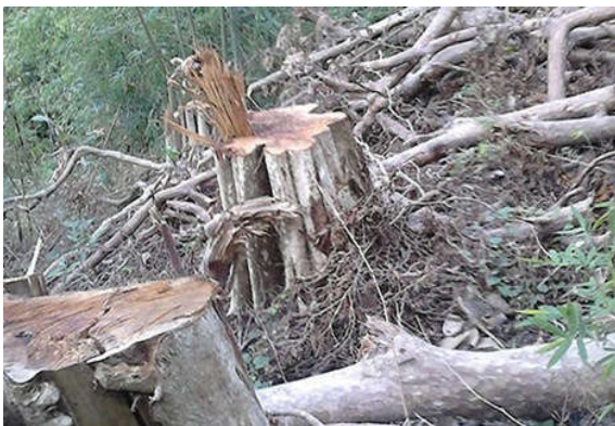
Cây bằng lăng bị triệt hạ tại tiểu khu 71 nhưng ban quản lý rừng và kiểm lâm vẫn chưa phát hiện.

Ngày 22-3, một nguồn tin cho biết Hạt Kiểm lâm huyện Bắc Bình (Bình Thuận) đã ra quyết định khởi tố vụ án hủy hoại rừng tại dốc Ho Lao thuộc tiểu khu 70 và vụ chặt cây dầu “khủng” có đường kính đến 2,36 m tại tiểu khu 73A.