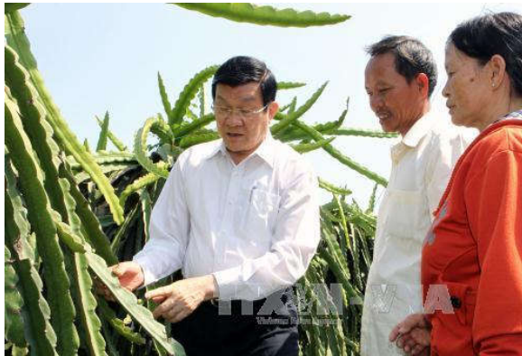
Chủ tịch nước Trương Tấn Sang tham quan mô hình kết hợp trồng thanh long với chăn nuôi đạt hiệu quả kinh tế cao của các hộ gia đình ở xã nông thôn mới Thiện Nghiệp, thành phố Phan Thiết.

Chủ tịch nước Trương Tấn Sang đã nghe lãnh đạo chủ chốt tỉnh cùng các bộ, ngành đánh giá kết quả thực hiện nhiệm vụ kinh tế xã hội của tỉnh.