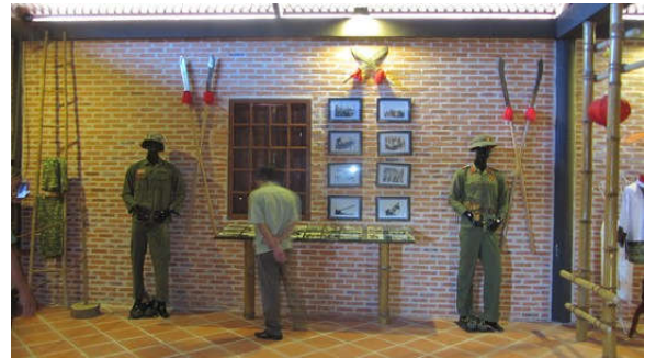
Trưng bày các loại vũ khí, trang phục, ảnh chiến tranh Việt Nam.