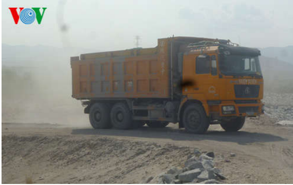
Xe chở xỉ than từ nhà máy vào bãi xỉ cách Quốc lộ 1A chưa đầy 1 km

phải mua nước lọc đóng bình sử dụng cho việc ăn uống.