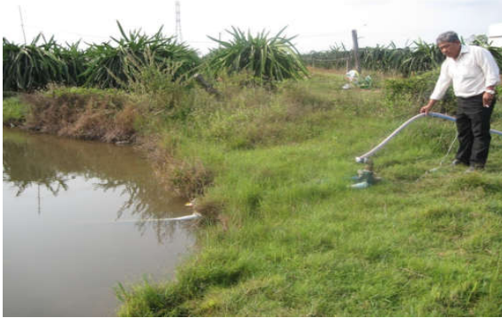
Ao chứa nước phục vụ tưới tiêu cây thanh long trong mùa khô hạn.

Nhiều người dân xã Hàm Liêm (Hàm Thuận Bắc, Bình Thuận) tâm sự rằng, nếu thời tiết nắng nóng tiếp tục, đất đai vốn dĩ đã xấu lại không có nước tưới thì nguy cơ cây thanh long chết rất cao.