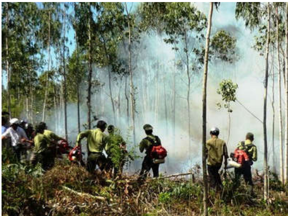
Lực lượng Kiểm lâm cháy rừng tại huyện Hàm Thuận Bắc

Trong năm 2014, toàn tỉnh xảy ra 27 trường hợp cháy rừng với tổng diện tích hơn 106 ha, giảm 6 trường hợp, nhưng diện tích tăng gần 26 ha. Quý I/2015, trên địa bàn tỉnh xảy ra 7 vụ cháy rừng, chủ yếu cháy thực bì, trảng cỏ, cây bụi không gây thiệt hại về cây gỗ.