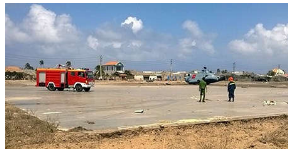
Lực lượng cứu hộ đang tiếp cận máy bay rơi.

Theo mô tả của những người chứng kiến, chiếc máy bay chuẩn bị đáp thì có tiếng nổ lớn hơn so với bình thường.