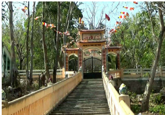
Linh Sơn cổ tự, nơi phát hiện chiếc ắn của vua Quang Trung

Chiếc ắn này được phát hiện hàng chục năm trước, tuy nhiên đến nay tỉnh Bình Thuận vận động người giữ ắn giao nộp thì vị này cho biết ắn vua đã thất lạc.