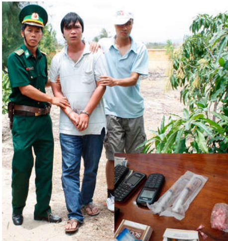
Đối tượng mua bán ma túy bị BDBP Bình Thuận bắt giữ và tang vật

Thời gian gần đây, ở tỉnh Bình Thuận tình trạng mua bán, tàng trữ trái phép các chất ma túy diễn biến phức tạp ở nhiều địa phương, nhất là các địa bàn ven biển. Nhiều đối tượng vừa nghiện, vừa mua bán tàng trữ các chất ma túy, hoạt động