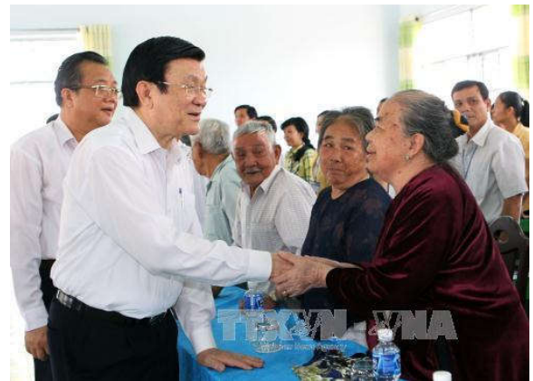
Chủ tịch nước Trương Tấn Sang thăm hỏi cán bộ, nhân dân ở xã nông thôn mới Thiện Nghiệp, thành phố Phan Thiết.

tiến độ đầu tư, xây dựng các công trình thủy lợi trên địa bàn; hỗ trợ xúc tiến mở rộng thị trường xuất khẩu các mặt hàng lợi thế: thanh long, cao su, thủy sản chế biến... chuyển giao kỹ thuật trong khai thác đánh bắt cá ngừ đại dương và bảo quản chế biến các thủy sản khai thác trên biển; sớm tháo gỡ vướng mắc và đẩy nhanh tiến độ thực hiện Nghị định 67 của chính phủ.