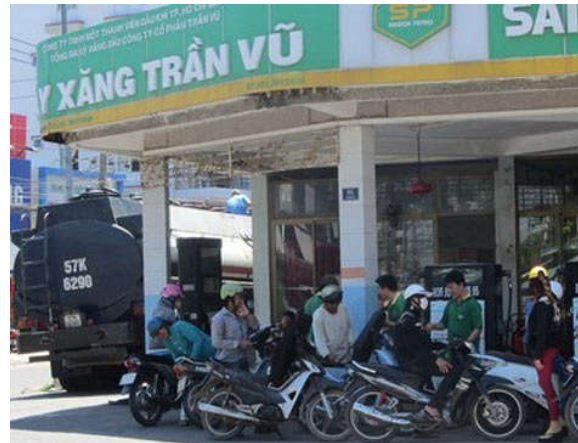
Những cây xăng bị Đoàn kiểm tra liên ngành tỉnh Bình Thuận “điểm mặt”.

Tương tự, cây xăng dầu Thành Đạt (DNTN Thương mại xăng dầu Thành Đạt, xã Sơn Mỹ, huyện Hàm Tân) cũng bị lập biên bản phạt và thu hồi hơn 72 triệu đồng.