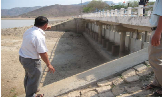
Nước trong lòng hồ Đá Bạc cạn kiệt.

đủ bảo vệ công trình và mạch nước ngầm, bởi chung quanh là đất khô cằn hết, dê, bò còn thông thả vào ra trong lòng hồ để kiếm ăn nữa".