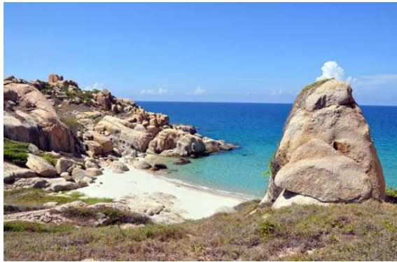
Những khối đá chồng tạo nên vẻ đẹp hiếm có của Cù Lao Câu.