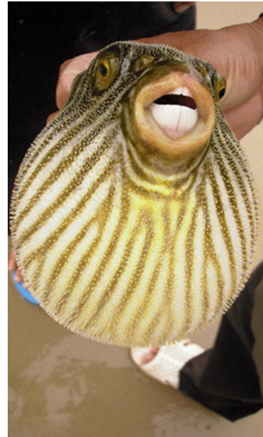
Bãi Ông Địa còn níu chân người bởi sự hiện diện của nhiều loài cá lạ