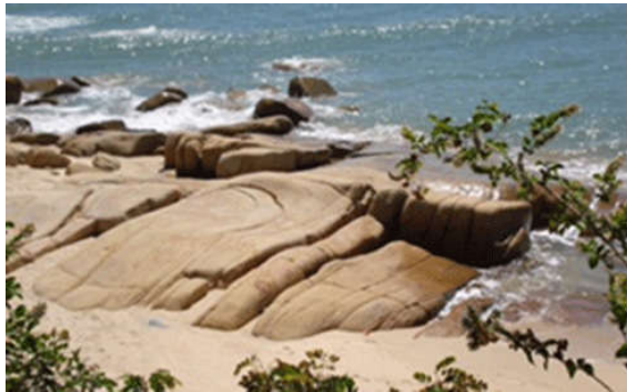
Những khối đá có hình thù kỳ quái

Dưới góc phi lao cổ thụ nhào mình về phía biển, cụ Năm Gánh, cư dân cổ cụ trong vùng, cho biết căn nguyên của tên gọi bãi đá Ông Địa bắt nguồn từ việc hàng trăm năm trước, ngư dân trong vùng phát hiện tảng đá có hình thù rất giống Ông Địa, cũng từ đó bãi bờ hao hao chết tên “bãi Ông Địa” đến bây giờ. “Tiếng là bãi Ông Địa nhưng kỳ thực đá ở đây muôn hình vạn trạng, đủ sắc màu, hình dáng nên khách du lịch gần xa rất thích đến chụp hình, ngoạn cảnh” - cụ Gánh bộc bạch.