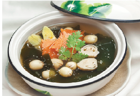
Món chay làm từ rong biển

món xào chay dùng với cơm nóng mà không cần cầu kỳ.