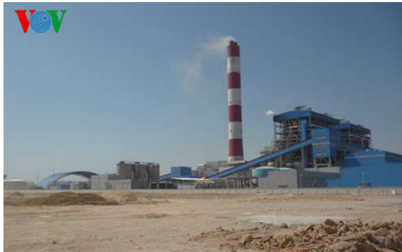
Nhà máy nhiệt điện Vĩnh Tân 2 đặt tại xã Vĩnh Tân, huyện Tuy Phong

Nằm giáp biển và bên cạnh Quốc lộ 1A, Nhà máy Nhiệt điện Vĩnh Tân 2 thuộc Trung tâm Nhiệt điện Vĩnh Tân, huyện Tuy Phong, tỉnh Bình Thuận, do Tập đoàn Điện lực Việt Nam làm chủ đầu tư có tầm vóc của một trung tâm công nghiệp năng lượng. Nhưng ít ai biết đằng sau đó là nỗi nhức nhối của người dân về vấn đề môi trường. Những cột khói đen liên tục xả ra từ nhà máy gây ảnh hưởng đến cuộc sống của hàng ngàn hộ dân ở phía Bắc huyện Tuy Phong. Nhất là gần đây, Nhà máy nhiệt điện Vĩnh Tân 2 còn cho xe vận chuyển xỉ than ra đổ dọc đường và đổ tràn lan ở bãi tập kết. Bãi xỉ không được xử lý theo đúng quy định, nên ảnh hưởng nghiêm trọng đến cuộc sống của người dân.