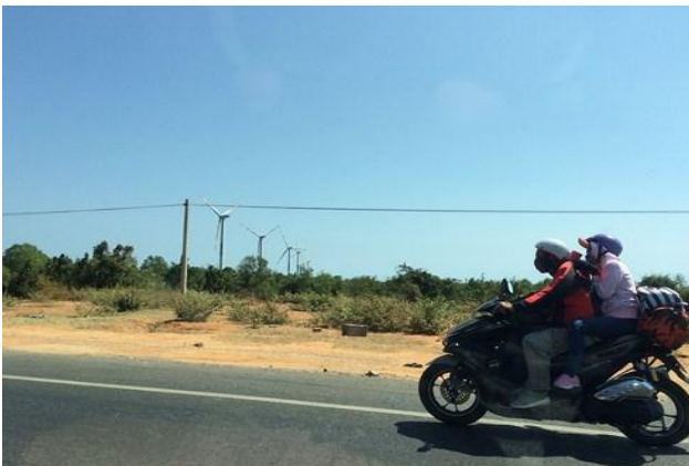
Trên cùng đường dọc bờ biển Mũi Né, du khách có thể ghé các điểm du lịch nổi tiếng khác như Đồi cát hồng, Bàu Trắng - Bàu Sen, Hòn Ghềnh...

Theo nhân viên công ty TNHH du lịch Thùy Trang, cụm bãi tắm ở Hòn Rơm có nhiều khu như Hòn Rơm 1, Hòn Rơm 2, Thùy Trang... tuy vậy, hầu hết các bãi tắm này chỉ dành cho du khách trong nước. Du khách nước ngoài thường tập trung tại các resort hay khách sạn cao cấp trên đường 706.