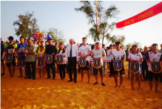
BTC trao giải cho các VĐV

Sáng 8/2 (mùng 4 Tết), tại đồi cát Mũi Né, Bình Thuận đã diễn ra hội thi chạy vượt đồi cát "Mừng Đảng - Mừng Xuân Kỷ Hợi 2019" thu hút rất đông người dân địa phương và khách du lịch đến xem và cổ vũ cho cuộc thi thể thao rất độc đáo này của thành phố biển Phan Thiết.