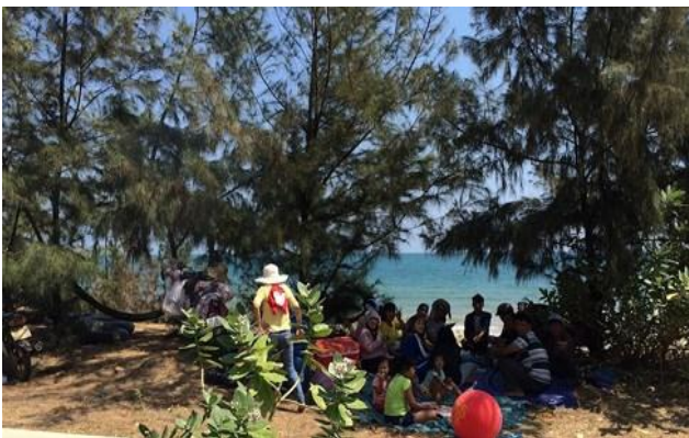
Một số gia đình bày biện đồ ăn thức uống tại các bóng mát dọc bãi biển, quây quần với nhau.