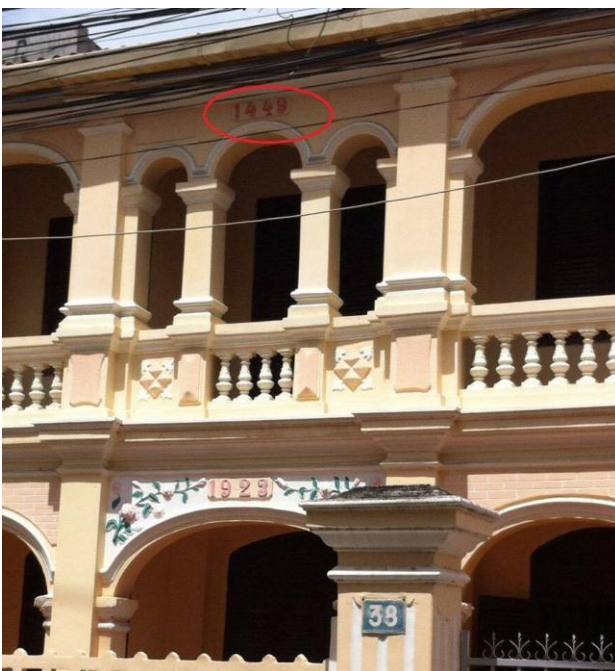
Ngôi nhà cổ và con số 1449 bí ẩn.

Ngôi nhà nằm ở địa chỉ số 38 đường Nguyễn Văn Trỗi - TP Phan Thiết. Đây là ngôi nhà có kiến trúc cổ, rất đẹp, đã được chủ nhân tu bổ lại nhưng vẫn giữ nguyên nét cổ kính của thời gian.