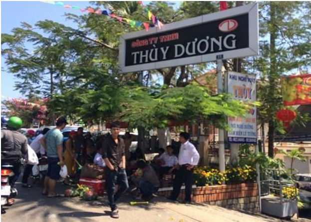
Dịp Tết này khách du lịch đổ về Mũi Né rất đông.