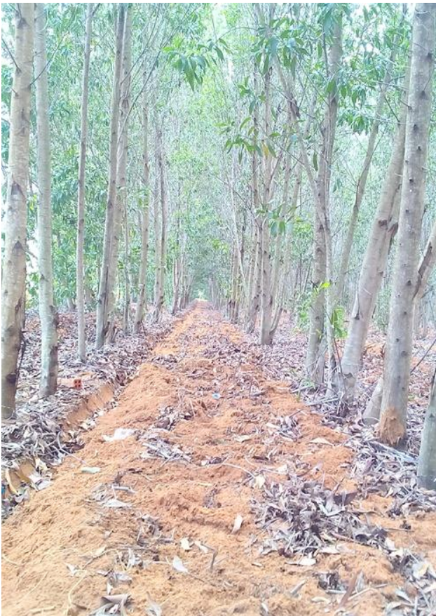
Cây băng trắng

Về phương tiện phục vụ chữa cháy, ngoài các xe ô tô, xe máy công vụ hiện có của các chủ rừng và lực lượng kiểm lâm, đã vận động các cá nhân và hộ gia đình đăng ký được 71 ô tô, 68 máy cày, 1.812 xe máy; công cụ thủ công phục vụ chữa cháy rừng có 1.389 cuốc, xẻng, rựa, cào cỏ... và 2.338 công cụ khác; riêng máy thổi gió đã trang bị cho các BQL rừng và lực lượng kiểm lâm 66 chiếc”, ông Hiếu chia sẻ.