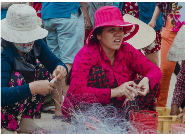
Khung cảnh ngư dân chài chờ thuyền về buổi sáng.