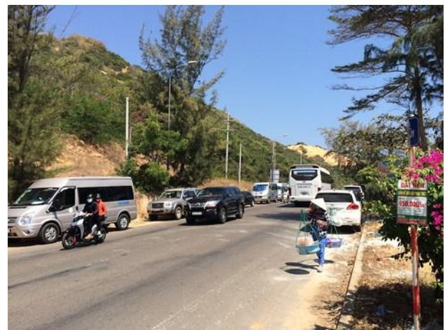
Du khách khắp nơi đổ về Mũi Né tắm biển.

Được biết đến là một trong những thiên đường du lịch biển đẹp nhất Việt Nam, Mũi Né có phong cảnh hoang sơ với những bãi cát trắng trải dài, biển xanh. Cũng như mọi năm, dịp Tết năm nay Mũi Né thu hút đông đảo khách du lịch khắp nơi.