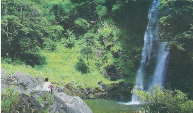
Vùng đất Phan Dũng ẩn chứa vẻ đẹp của một miền sơn cước hữu tình

Vượt qua con đường quanh co, uốn lượn bên sườn núi cao vời vợi, Phan Dũng (huyện Tuy Phong, tỉnh Bình Thuận) đón chúng tôi bằng khung cảnh của một miền sơn cước hữu tình với sắc mai vàng rực rỡ xen lẫn màu tím ngan ngát của phong lan.