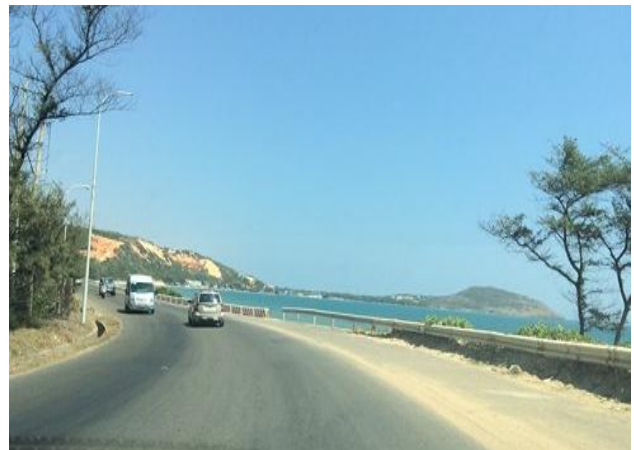
Phong cảnh biển xanh, cát trắng đặc trưng của Mũi Né, làm say đắm du khách thập phương.

Phương Nam // https://infonet.vn.-2019 (ngày 10 tháng 2)