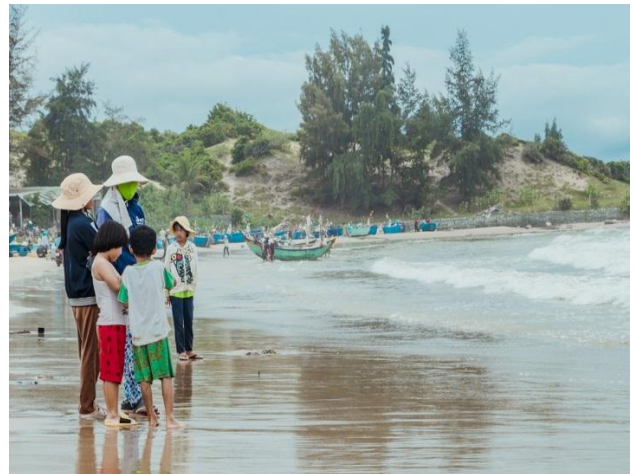
Guest House Hòa Thắng: Nơi có Đồi, Biển, Ngư Dân

bãi biển để những bữa ăn thêm không khí lãng mạn và thi vị.