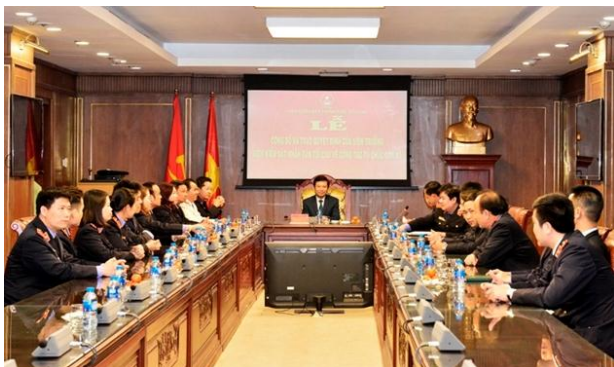
Toàn cảnh buổi Lễ

C hiều 11/2 tại Hà Nội, VKSND tối cao đã tổ chức Lễ công bố và trao quyết định của Viện trưởng VKSND tối cao về việc bổ nhiệm giữ chức vụ Vụ trưởng Vụ thực hành quyền công tố và kiểm sát điều tra án xâm phạm hoạt động tư pháp, tham nhũng, chức vụ xảy ra trong hoạt động tư pháp (Vụ 6), VKSND tối cao.