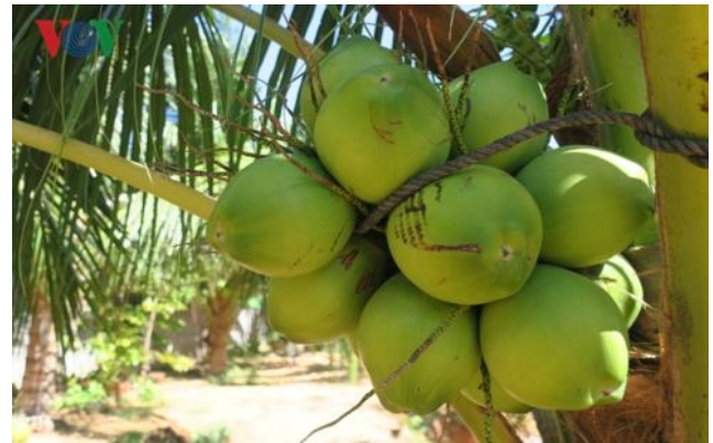
Nông dân phường Hàm Tiến thay giống dừa mới nhanh cho thu hoạch và trái nhiều hơn