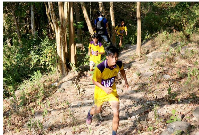
Các vận động viên tranh tài ở phần thi leo núi.

Sau nhiều lần tổ chức, Hội thi leo núi Tà Cú đã trở thành điểm hẹn quen thuộc của các vận động viên đến từ các tỉnh miền Đông Nam Bộ, miền Trung và Tây Nguyên.