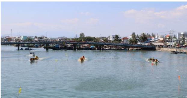
Lễ hội đua thuyền truyền thống tạo không khí vui tươi trong dịp đầu xuân.

Chiều ngày 6/2, tức ngày mừng 2 Tết, Thành phố Phan Thiết (tỉnh Bình Thuận) đã tổ chức lễ hội đua thuyền trên sông Cà Ty, thu hút hàng nghìn người đến xem và cổ vũ. Đây là hoạt động văn hóa truyền thống của cư dân vùng biển Phan Thiết vào mỗi độ xuân về.