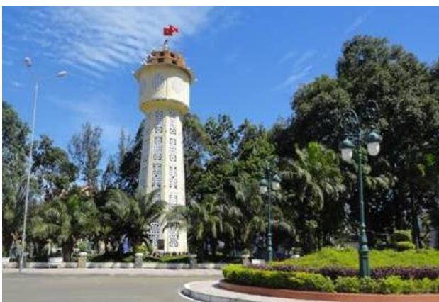
Tháp nước Phan Thiết.

N gày 26/2/2019, UBND thành phố Phan Thiết đã phối hợp với Sở Văn hóa, Thể thao và Du lịch tổ chức Lễ đón Bằng công nhận di tích lịch sử - văn hóa cấp tỉnh đối với Tháp nước Phan Thiết.