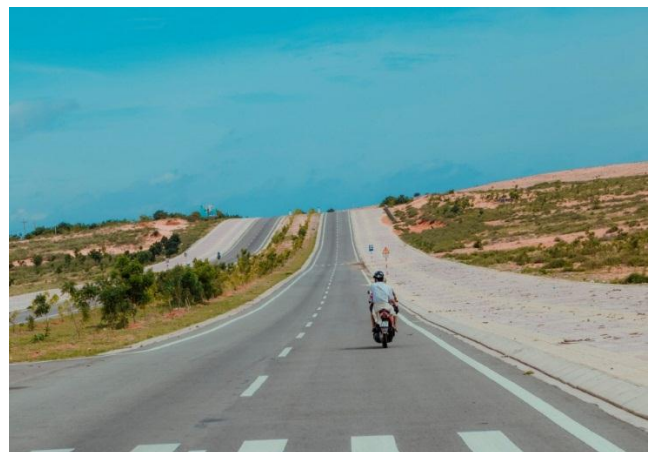
Bàu Trắng – Cung đường phượt hấp dẫn nổi tiếng khi có cả biển và núi.

Hòn Rơm đến Mũi Né, qua chợ Mũi Né, Đồi Hồng đi khoảng 1h/ đồng hồ tới Bàu Trắng. Ở cung đường này, sẽ đi qua một bãi biển tuyệt đẹp, nhiều con đường uốn lượn mang đậm cảm giác chiêm nghiệm dành cho dân du lịch khám phá Biển. Nếu là người yêu rừng thì chọn cách di chuyển từ hòn rơm 8 km hay đi từ Lương Sơn xuống, rồi từ Hòn Rơm sẽ có nhiều quan cảnh hữu tình, thiên nhiên thắm đượm sự gần gũi khi đến với Guest House Hòa Thắng có cả Rừng và Biển để du khách lựa chọn. Một thiên nhiên đẹp đúng theo câu: Phong cảnh hữu tình, cách chùng đó khoảng 5km sẽ là một không gian tĩnh lặng tựa thiên đường dành cho gia đình và những ai yêu biển, mến đồi. Để rồi cứ mỗi sáng lại nghe âm thanh của biển từ cuộc sống của những người dân chài, tiếng rừng cây, âm thanh xào xạc của lá.