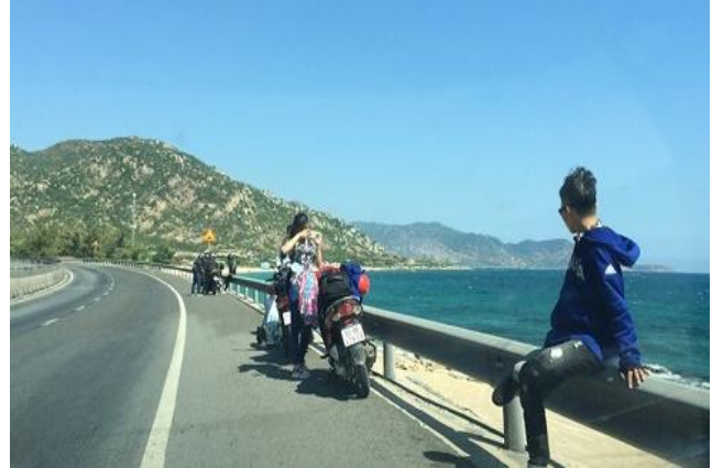
Từng nhóm phượt dừng lại ven đường chụp ảnh.

Theo nhân viên công ty TNHH du lịch Thùy Trang, cụm bãi tắm ở Hòn Rơm có nhiều khu như Hòn Rơm 1, Hòn Rơm 2, Thùy Trang... tuy vậy, hầu hết các bãi tắm này chỉ dành cho du khách trong nước. Du khách nước ngoài thường tập trung tại các resort hay khách sạn cao cấp trên đường 706.