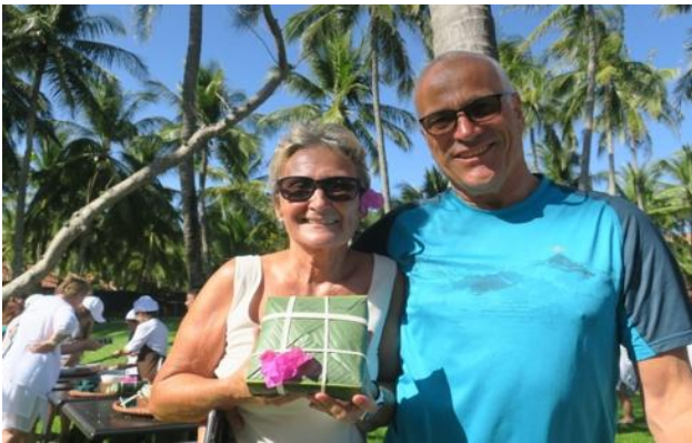
Du khách thích thú khi tự tay làm được chiếc bánh chưng

thống của dân tộc Việt Nam đến với du khách quốc tế. Trong đó, lễ hội gói bánh chưng là một trong những hoạt động có ý nghĩa sâu sắc.