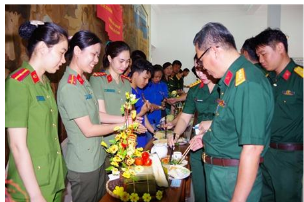
Các hoạt động trong hội thi gói bánh chưng.