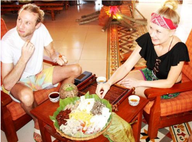
Khách nước ngoài đón tết cổ truyền của Việt Nam. Ảnh minh họa.

Nhiều đoàn khách du lịch ở các tỉnh thành phía Nam và Tây Nguyên đã đến các khu du lịch ven biển Bình Thuận du xuân trong dịp Tết.