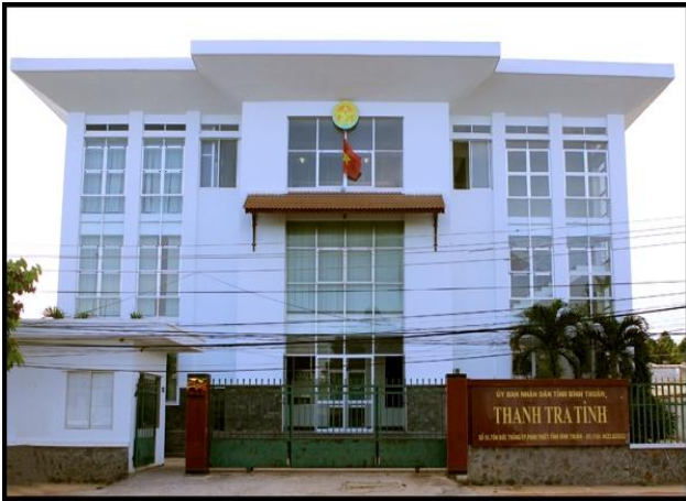
Thanh tra tỉnh Bình Thuận

UBND tỉnh Bình Thuận đứng đầu bảng xếp hạng cải cách hành chính 2018 với tỷ lệ chỉ số đạt 98,7%.