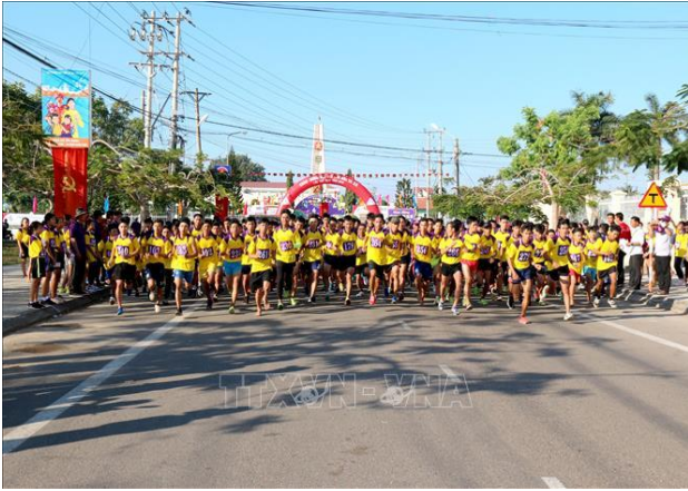
Các vận động viên nam xuất phát.

Các vận động viên tham gia tranh tài theo theo 2 cự ly 6.300m (chạy 4.000m và leo núi 2.300m) dành cho nam; 5.300m (chạy 3.000m và leo núi 2.300m) dành cho nữ.