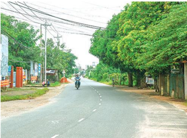
Thành phố Phan Thiết: Đổi thay nhờ xây dựng nông thôn mới.