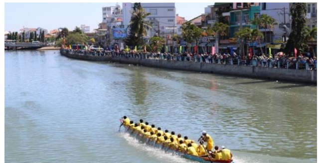
Hàng ngàn người dân đứng dọc bên bờ sông để cổ vũ nhiệt tình.

Bên cạnh sự dày công tập luyện của các vận động viên, một trong những yếu tố tạo nên sự thành công trong giải thi đấu là sự cổ vũ nhiệt tình của khán giả. Trong cái nắng đầu xuân, nhiều tầng lớp nhân dân địa phương cũng như du khách đã đến xem và cổ vũ tạo nên một không khí rộn ràng, nhộn nhịp mang đậm sắc xuân.