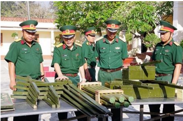
Bộ CHQS tỉnh kiểm tra công tác chuẩn bị huấn luyện tại huyện Phú Quý