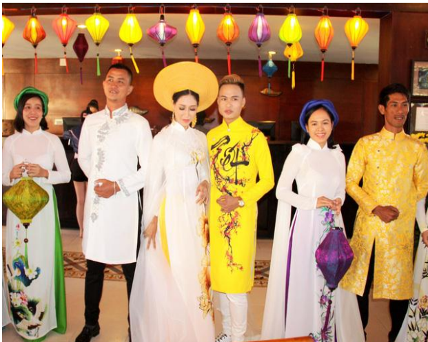
Lượng khách lưu trú sẽ tăng cao trong dịp Tết Kỷ Hợi.