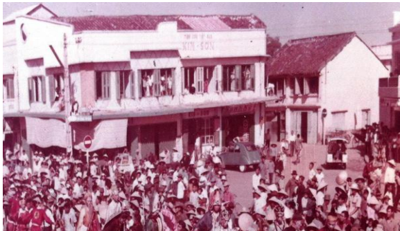
Tiệm cơm Kim Sơn Lầu năm 1967

P han Thiết từ xa xưa đã có nhiều sản vật, công trình, cơ sở nổi tiếng khắp trong Nam ngoài Bắc tồn tại đến ngày nay. Nam Thạnh Lầu, Kim Sơn Lầu là hai trong số những niềm tự hào của người Phan Thiết (Bình Thuận).