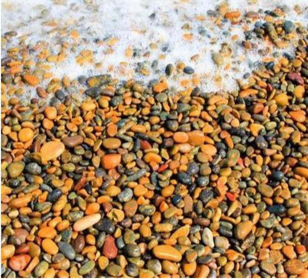
Bãi đá 7 màu tuyệt đẹp ở Bình Thuận.

UBND tỉnh giao Sở Văn hóa, Thể thao và Du lịch chỉ đạo Bảo tàng tỉnh đưa vào kế hoạch khảo sát, nghiên cứu, xây dựng hồ sơ khoa học và khoanh vùng bảo vệ thắng cảnh bãi đá 7 màu, bãi rêu tại xã Bình Thạnh, huyện Tuy Phong để trình UBND tỉnh xem xét, xếp hạng thắng cảnh cấp tỉnh vào năm 2020 (sau khi đã thực hiện khôi phục cơ bản hiện trạng bãi đá 7 màu và bãi rêu).