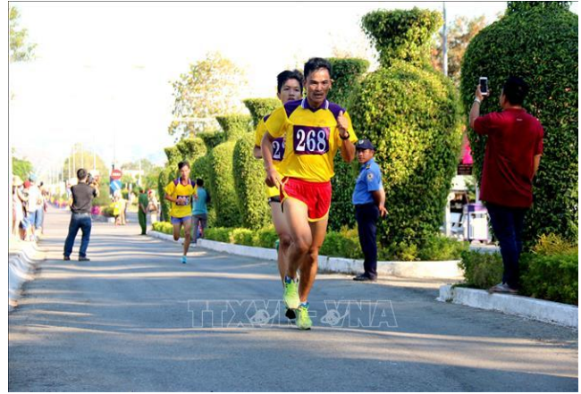
Các vận động viên nam thi đấu chặng về đích.

phương nhằm phát triển phong trào thể dục thể thao quần chúng và chuyên nghiệp, tạo không khí vui tươi, phấn khởi, lành mạnh trong những ngày đầu năm mới.