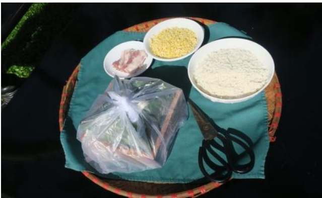
Nguyên liệu làm bánh chưng được BTC chuẩn bị sẵn

Năm nào cũng vậy, nhiều khu nghỉ mát ở Mũi Né đều tổ chức lễ hội làm bánh chưng cho du khách đang có kỳ nghỉ tại đây. Năm nay lễ hội tiếp tục được duy trì, thu hút hơn 200 du khách tham gia và cổ vũ, trong đó hơn 30 người trực tiếp thi gói bánh. Ban tổ chức chuẩn bị sẵn nguyên liệu làm bánh gồm: nếp, đậu xanh, thịt heo, lá dong, lạt tre và khung gỗ.