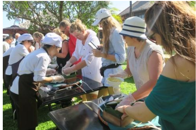
Một nhóm du khách châu Âu đang gói bánh chưng

Du khách trầm trồ khi biết được món ẩm thực này có từ thời vua Hùng dựng nước và chiều sâu giá trị văn hóa của món bánh chưng trong ngày Tết của dân tộc Việt.