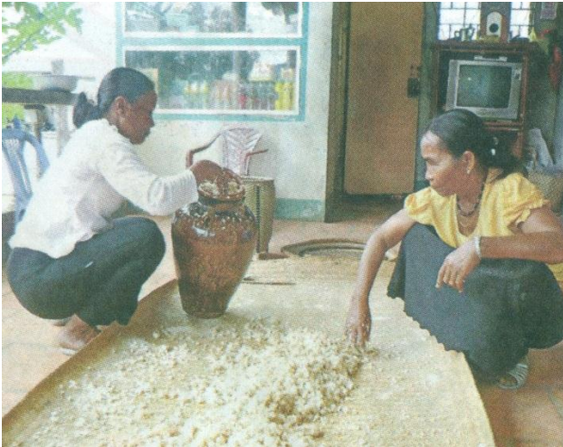
Người dân Phan Dũng làm rượu cần từ hạt gạo trên nung để cúng thần linh và đãi khách trong dịp lễ, Tết

dụng nhiều thiết bị khác phục vụ sinh hoạt gia đình. Đáng mừng là bà con đồng bào Raglai đã biết tiếp cận với một số tiến bộ khoa học kỹ thuật, phát huy thế mạnh chuyển đổi cây trồng... Nhiều hộ chăn nuôi bò, dê, heo đen và mua sắm cả máy cày để sản xuất nông nghiệp. Bộ mặt làng xã ngày càng tiến bộ hơn.