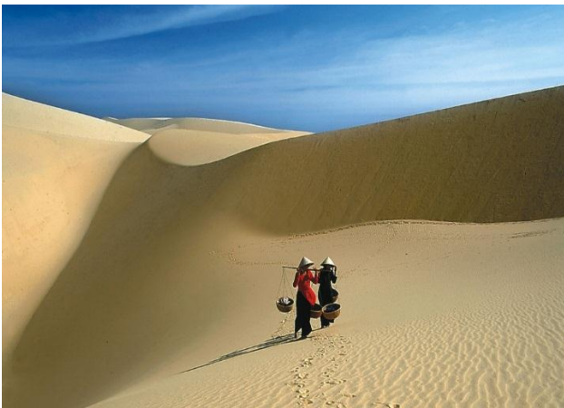
Đồi cát Bàu Trắng nơi được mệnh danh là Maldives thứ 2

B ình Thuận thuộc tỉnh duyên hải cực Nam Trung Bộ, nơi sở hữu nhiều bãi biển đẹp như mộng, một “Maldives” vừa chất chứa sự hoang sơ của biển cả vừa kiêu diễm và bồng rập như một “cô gái xinh đẹp” bởi những đồi cát trắng. Với Bình Thuận, mọi lữ khách sẽ không cảm được lòng khi được dừng chân và thăm nhiều địa danh du lịch bí ẩn và nghỉ dưỡng đặc biệt “có một không hai” tại Việt Nam.