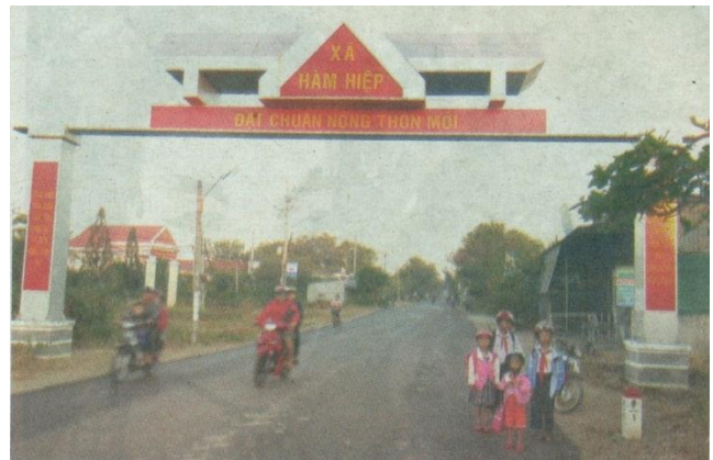
Hàm Hiệp ngày nay