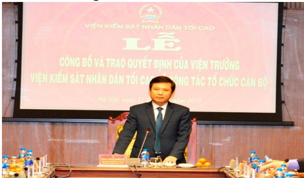
Đồng chí Viện trưởng VKSND tối cao Lê Minh Trí phát biểu giao nhiệm vụ tại buổi