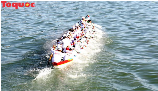
Hội đua thuyền truyền thống trên sông Cà Ty

N gày 7/2 (tức mùng 2 Tết), tại di tích tháp Pô Sah Inư - Phan Thiết (tỉnh Bình Thuận) đã liên tục diễn ra nhiều hoạt động văn hóa nghệ thuật độc đáo phục vụ nhu cầu du xuân, đón Tết của nhân dân địa phương và khách du lịch.