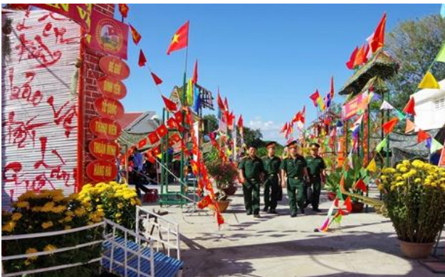
Hội trại tổng quân năm 2019.

Tại đảo Phú Quý, hòa trong không khí náo nức của những ngày xuân mới, 40 thanh niên đầy nhiệt huyết của huyện đảo cũng lên đường nhập ngũ. Đại diện cấp ủy, chính quyền và đông đảo nhân dân đến chúc mừng, tặng quà và tiễn tân binh lên đường làm nhiệm vụ bảo vệ Tổ quốc. Năm 2019, Phú Quý có thanh niên nhập ngũ đạt chất lượng cao nhất từ trước đến nay. Chỉ tiêu 40 quân, có 1 đảng viên và 32 thanh niên viết đơn tình nguyện, trên 50% thanh niên trình độ THPT trở lên, có 3 tốt nghiệp cao đẳng, đại học.