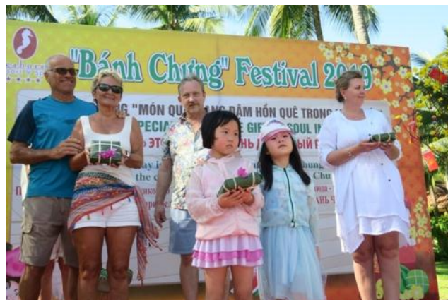
Những chiếc bánh được hoàn thành nhanh nhất

Những chiếc bánh chưng tự tay du khách làm sẽ được nấu lên và chia cho du khách thưởng thức trong ngày Tết Việt. Có thể thấy, việc tổ chức các hoạt động truyền thống như thế này đã góp phần giới thiệu, quảng bá văn hóa Việt Nam đến với bạn bè quốc tế.