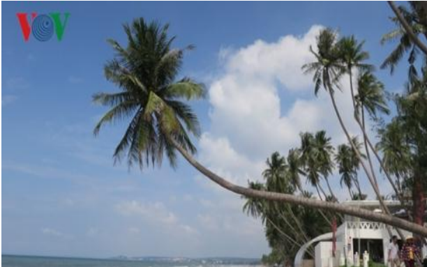
Biển Rạng Hàm Tiến và Mũi Né thêm đẹp nhờ những rặng dừa thơ mộng