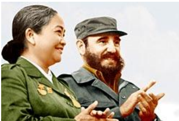
Nữ tướng Nguyễn Thị Định và Chủ tịch Cuba Fidel Castro.