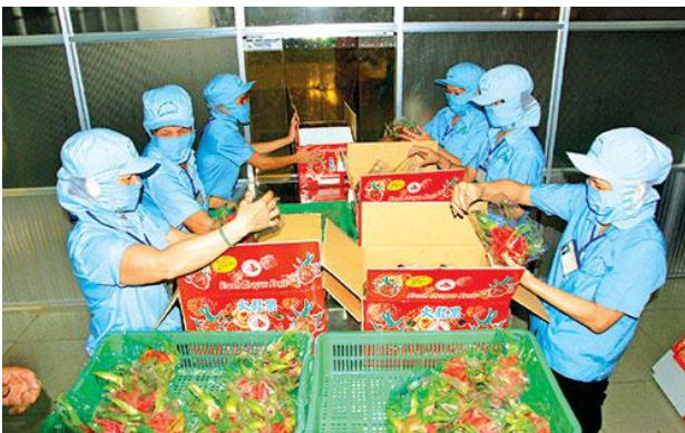
Hỗ trợ phụ nữ học nghề, tạo việc làm.

phối hợp tổ chức nên chị Hoa đã áp dụng vào sản xuất cho năng suất cây trồng đạt cao. Với sự cần cù, chịu khó làm ăn, sau vài năm vợ chồng chị đã trả hết số vốn vay và tích lũy được một số tiền đầu tư mua thêm đất sản xuất và nuôi thêm bò sinh sản. Đến nay, gia đình chị Hoa sở hữu trên 6 ha đất canh tác, đầu tư thêm máy cày, xe tải chở nông sản. Ngoài ra, vợ chồng chị còn làm thêm nghề mua bán cây công nghiệp như keo, bạch đàn... Nhờ đó, chị đã xây dựng nhà cửa khang trang, sắm sửa đầy đủ mọi tiện nghi trong gia đình và lo cho các con ăn học đến nơi đến chốn.