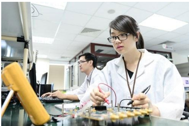
Phụ nữ Viettel tham gia nghiên cứu sản xuất thiết bị công nghệ.

Phụ nữ (LHPN) Việt Nam đã phát động phong trào phụ nữ “Ba đảm nhiệm” với nội dung: Đảm nhiệm sản xuất, công tác, thay thế cho nam giới đi chiến đấu; đảm nhiệm gia đình, khuyến khích chồng con yên tâm chiến đấu; đảm nhiệm phục vụ chiến đấu và SSCĐ khi cần thiết. Chủ tịch Hồ Chí Minh rất quan tâm chỉ đạo phong trào và đổi tên phong trào thành “Ba đảm đang”, có ý nghĩa vừa giản dị, vừa phù hợp với truyền thống của PNVN, càng tăng thêm sức mạnh động viên, lôi cuốn mọi tầng lớp phụ nữ và trở thành mốc son chói lọi trong lịch sử phong trào PNVN.