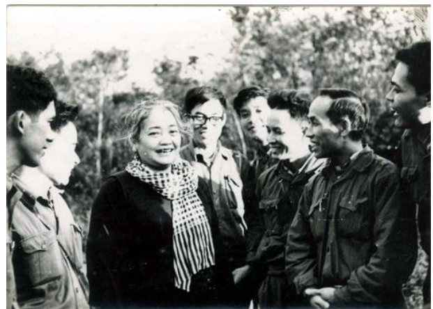
Tác giả (ngoài cùng, bên phải) trong cuộc gặp gỡ bất ngờ với bà Nguyễn Thị Định giữa rừng Trường Sơn.

của nhân vật lừng danh cả nước đã 15 năm nay từ Phong trào Đồng khởi Bến Tre, đã đứng ngay đầu võng của mấy anh em chúng tôi. Trời ơi! Gặp ai thì gặp, nhưng gặp một huyền thoại sống như bà Định, lại là một người phụ nữ “rất phụ nữ” như bà giữa đại ngàn Trường Sơn thế này thì ngạc nhiên và thú vị quá trời! Thế là không ai bảo ai, tất cả chúng tôi đều reo lên: “Ồi, chị Định!”.