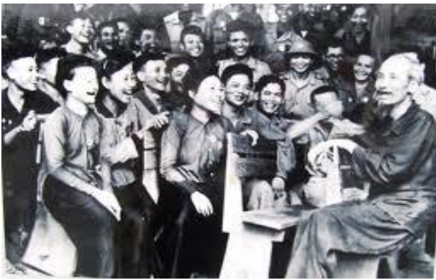
Bác Hồ với Phụ nữ Việt Nam.

Dưới ánh sáng cách mạng và khoa học của chủ nghĩa Mác-Lênin, cống hiến quan trọng của Hồ Chí Minh không chỉ dừng lại ở nhận thức về sự bất bình đẳng giữa phụ nữ và nam giới, về những người phụ nữ bị hạ nhục về tinh thần và thể xác, mà quan trọng hơn là “cái tạo thế giới”, giải phóng phụ nữ.