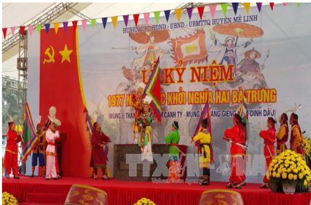
Lễ kỷ niệm 1977 năm khởi nghĩa Hai Bà Trưng (Ảnh Tạp chí Tuyên giáo)

Tiếp nối chiến công hiển hách của Hai Bà Trưng đầu thế kỷ, phụ nữ Việt Nam luôn chắc tay liềm, vững tay súng, cùng với dân tộc Việt Nam làm nên huyền thoại trong hai cuộc kháng chiến thần thánh chống thực dân Pháp và đế quốc Mỹ xâm lược, hoàn thành sự nghiệp giải phóng dân tộc, đưa cả nước đi lên xây dựng chủ nghĩa xã hội.