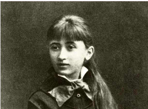
Rosa Luxemburg lúc còn nhỏ.

Rosa Luxemburg sinh ngày 5/3/1871 trong một gia đình gốc Do Thái tại một thị trấn nhỏ vùng biên giới của nước Ba Lan thuộc Nga. Bà là con út trong số 5 anh chị em nhưng lại là người thông minh nhất. Sớm tiếp nhận từ cha mẹ tinh thần yêu chuộng tự do cũng như lòng hâm mộ văn học nghệ thuật, 5 tuổi bà đã biết làm thơ, lớn lên có biệt tài viết lách và diễn thuyết.