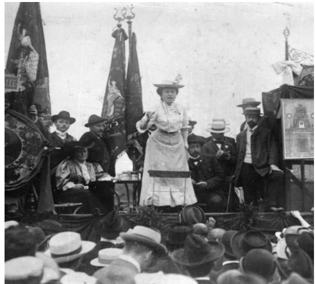
Trong quãng đời hoạt động cách mạng ngắn ngủi của mình, bà liên tục bị bắt giam và cuối cùng bị sát hại vào ngày 15/1/1919.

Tháng 7/1893, khi đang còn là sinh viên, bà cùng Leo Jogiches sáng lập tạp chí 'Sự nghiệp công nhân' và tháng 3 năm sau hai người lại đồng sáng lập Đảng Xã hội Dân chủ Vương quốc Ba Lan. Rosa vừa học tập, vừa viết bài mang tính xã luận cho tờ 'Sự nghiệp Công nhân' - cơ quan ngôn luận của Đảng Dân chủ Xã hội Vương quốc Ba Lan.