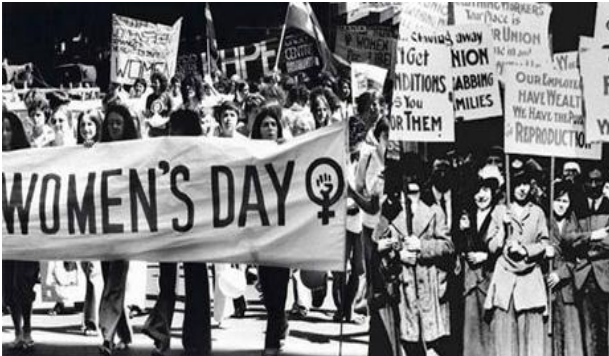
Những người phụ nữ đứng lên đấu tranh cho mình

Từ đó, ngày 8/3 hàng năm trở thành ngày đấu tranh chung của phụ nữ lao động trên toàn thế giới, là biểu dương ý chí đấu tranh của phụ nữ khắp nơi trên thế giới đấu tranh vì độc lập dân tộc, dân chủ, hòa bình và tiến bộ xã hội; vì quyền lợi hạnh phúc của phụ nữ và nhi đồng.