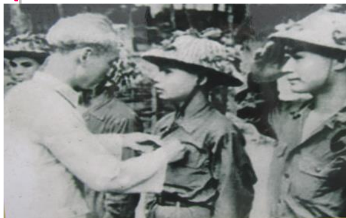
Gắn huy hiệu chiến sĩ Điện Biên cho bộ đội xuất sắc