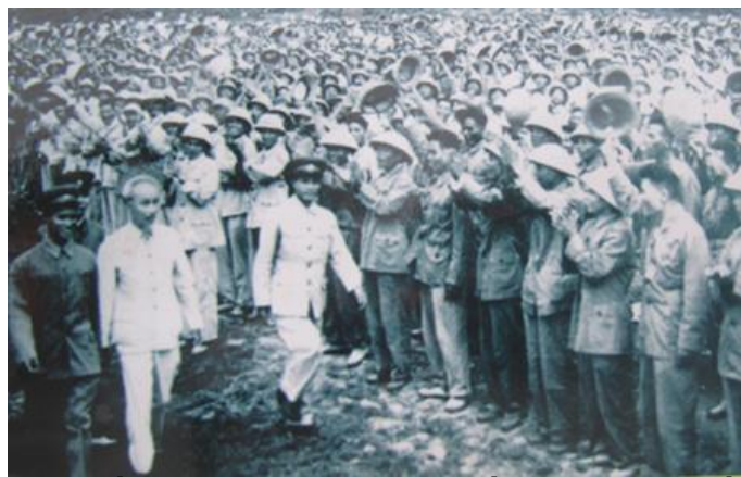
Bác Hồ thăm một đơn vị miền Nam tập kết năm 1957