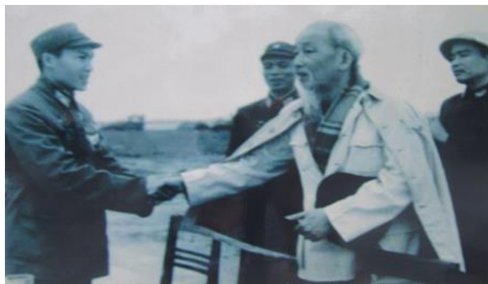
Bác đến thăm một cán bộ phòng không tại xã Phú Cường, Sóc Sơn, Hà Nội tháng 12/1967