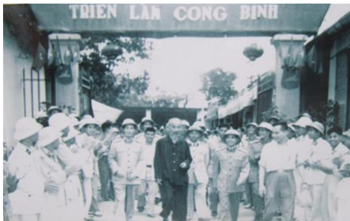
Giãn dị đến tham dự triển lãm công binh