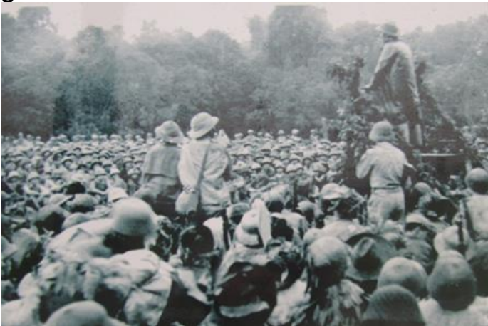
Bác Hồ nói chuyện với cán bộ chiến sĩ pháo phòng không năm 1950