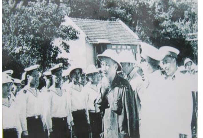
Thăm một đơn vị Hải quân năm 1954