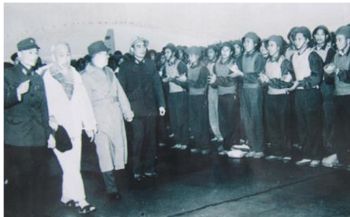
Thăm đơn vị đảm bảo kỹ thuật đường băng thuộc quân chủng Phòng không - Không quân vào Tết Đinh Mùi