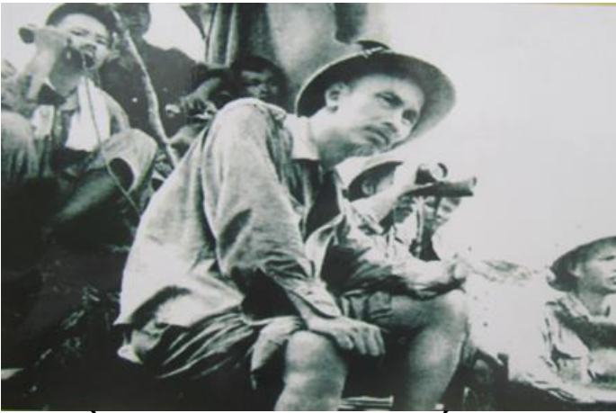
Bác Hồ quan sát trận địa ở chiến dịch Biên giới 1950