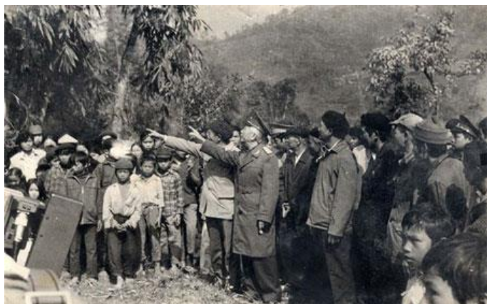
Tháng 12 năm 1989, Đại tướng Võ Nguyên Giáp- người chỉ huy trận Phai Khắt và Nà Ngần về thăm lại chiến trường xưa.