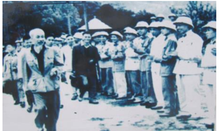
Thăm bộ đội Hải quân bảo vệ bờ biển tỉnh Quảng Ninh năm 1957