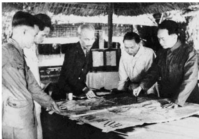
Chủ tịch Hồ Chí Minh và các đồng chí lãnh đạo Đảng, Nhà nước họp bàn quyết định mở chiến dịch Điện Biên Phủ

Sự quan tâm của Bác đối với lực lượng vũ trang nhân dân thể hiện bằng những việc làm cụ thể, bình dị nhưng chứa chan tình cảm của vị Cha già dân tộc. Và cũng vinh dự và tự hào thay, lực lượng chính quy, tinh nhuệ này đã được gọi với cái tên hết sức thân mật - Bộ đội cụ Hồ.