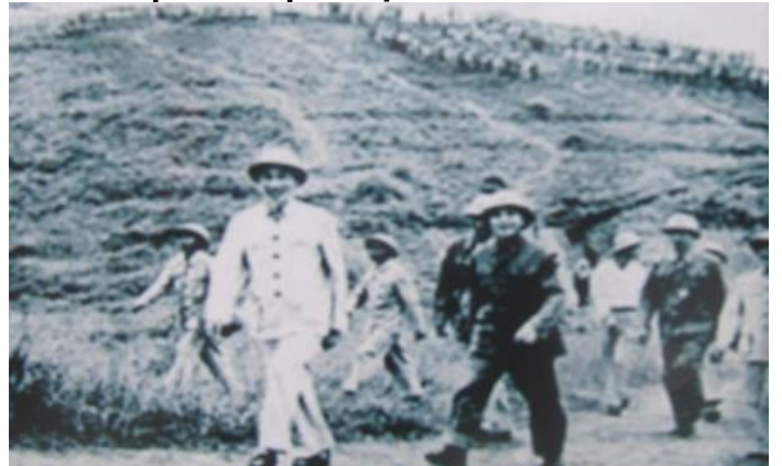
Chủ tịch Hồ Chí Minh thăm bộ đội diễn tập năm 1957