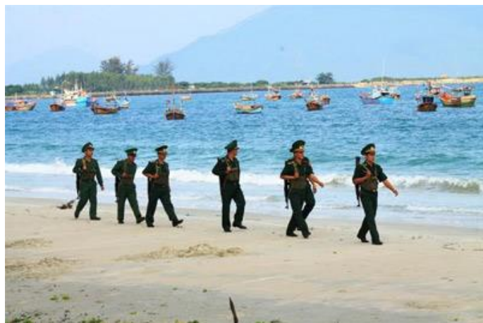
Tuần tra trên biển

* Ngày 19-12 , tại TP Đông Hà (Quảng Trị), Hội Khuyến học tỉnh, Bộ Chỉ huy Quân sự tỉnh, Bộ Chỉ huy Bộ đội Biên phòng tỉnh, Hội Cựu chiến binh tỉnh Quảng Trị phối hợp tổ chức lễ trao học bổng "Vòng tay đồng đội" năm 2015.