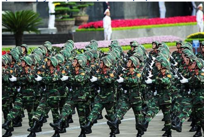
Ảnh minh họa/ qdnd.vn

Trong suốt tiến trình của cách mạng Việt Nam và qua 71 năm xây dựng, chiến đấu, trưởng thành, Quân đội ta đã viết nên truyền thống vẻ vang: “Trung với Đảng, hiếu với dân, sẵn sàng chiến đấu hy sinh vì độc lập, tự do của Tổ quốc, vì chủ nghĩa xã hội. Nhiệm vụ nào cũng hoàn thành, khó khăn nào cũng vượt qua, kẻ thù nào cũng đánh thắng”. Nhân dân ta đã ghi nhận, khen ngợi bản chất truyền thống tốt đẹp của QĐND Việt Nam với danh hiệu cao quý: “Bộ đội Cụ Hồ - Bộ đội của dân”.