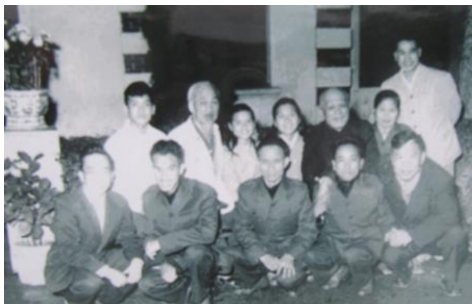
Bác Hồ chụp ảnh lưu niệm cùng bộ đội giải phóng miền Nam ngày 20/12/1962