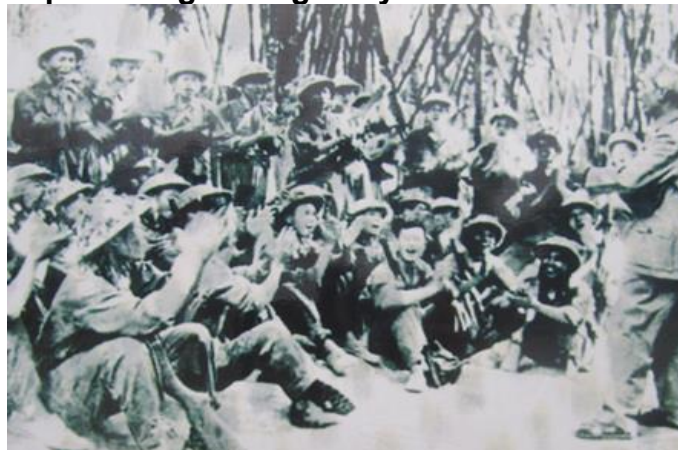
Bác Hồ với cán bộ, chiến sĩ đơn vị 600 tại Na Đòng, Trung Sơn, Yên Sơn năm 1953