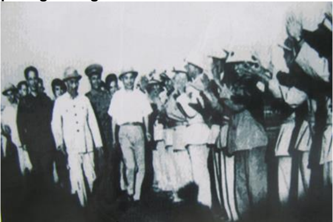
Với cán bộ, chiến sĩ quân khu 4 năm 1957