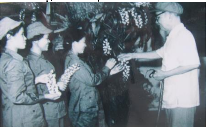
Với cán bộ, chiến sĩ Quân đoàn 938