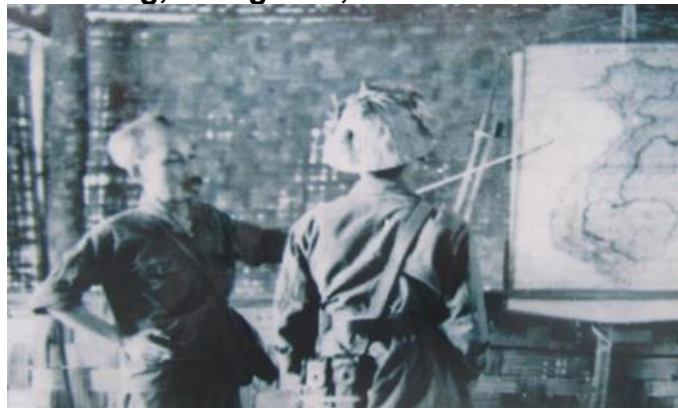
Với cán bộ chiến sĩ quân đoàn 1146