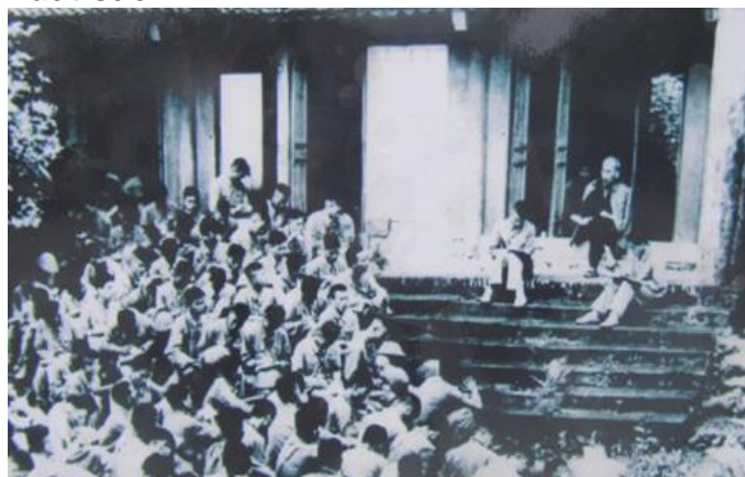
Bác Hồ nói chuyện với cán bộ, chiến sĩ Quân đoàn 16 tại Đền Hùng (Phú Thọ): "các Vua Hùng đã có công dựng nước, Bác cháu ta phải cùng nhau giữ lấy nước"