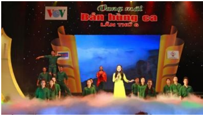
Tiết mục văn nghệ tại Chương trình giao lưu - nghệ thuật "Vang mãi bản hùng ca" lần thứ 6.

Kỷ niệm 71 năm Ngày thành lập QĐND Việt Nam, tối 19-12, Tạp chí Tuyên giáo (Ban Tuyên giáo T.Ư) phối hợp Truyền hình Quốc hội Việt Nam, Báo Nhà báo và Công luận, Công ty Truyền thông Thủ Đô tổ chức chương trình giao lưu - nghệ thuật "Vang mãi bản hùng ca" lần thứ 6 tại Trung tâm nghệ thuật Âu Cơ (Hà Nội). Tham gia biểu diễn có nhiều nghệ sĩ trẻ được mến mộ với các tiết mục ca múa nhạc đặc sắc, đan xen cùng phần giao lưu với các nhân chứng lịch sử được thể hiện theo ba phần: Một thời giới tuyến; Huyền thoại Tàu không số và Uống nước nhớ nguồn. Thông qua chương trình, Ban tổ chức trao 80 sổ tiết kiệm; 200 suất quà tặng thân nhân liệt sĩ, thương binh, cựu chiến binh, nạn nhân chất độc da cam; và xây dựng các công trình đền ơn đáp nghĩa tại xã Triệu Long, huyện Triệu Phong, tỉnh Quảng Trị với tổng số tiền gần hai tỷ đồng.