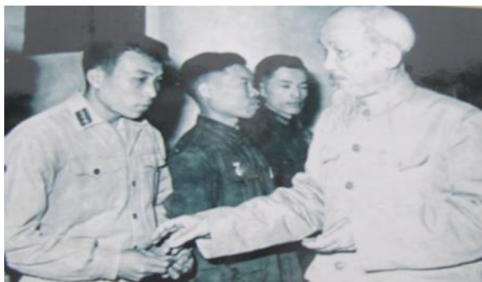
Tặng Huy hiệu cho các chiến sĩ lập công xuất sắc