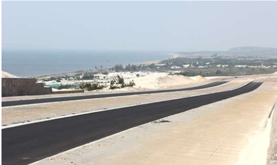
Một đoạn đường ven biển đã được thăm nhạ

Dự án đường ven biển Bình Thuận có điểm đầu tại ngã ba Hồng Thắng (xã Hòa Thắng, huyện Bắc Bình) và điểm cuối giao với cầu Sông Lũy kết nối với QL1 (xã Hòa Phú, huyện Tuy Phong).