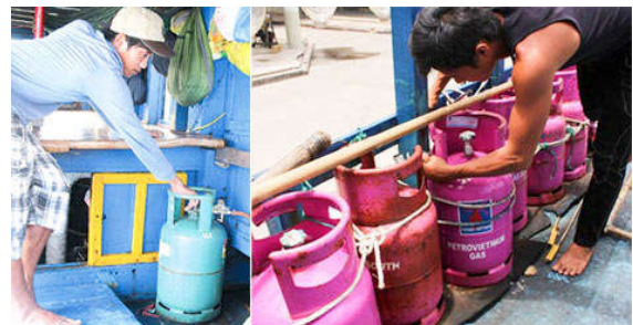
Những bình gas trên tàu cá - thủ phạm nhiều vụ cháy nổ trên biển.

Đã từng xảy ra những vụ nổ bình gas với hậu quả, thiệt hại khôn lường. Ngày 7/9/2015, tàu đánh cá mang số hiệu BTh - 98603TS của HTX thu mua hải sản