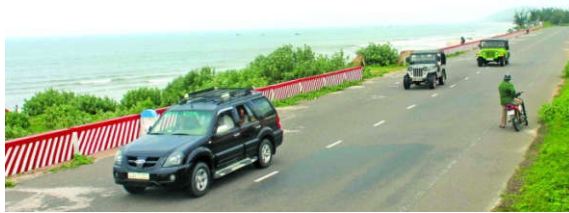
Một đoạn đường ven biển Hàm Tân, tỉnh Bình Thuận.