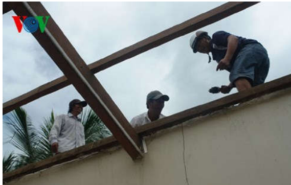
Gần 100 hộ gia đình bị thiệt hại do lốc xoáy

Liên quan đến cơn lốc xoáy kinh hoàng xảy ra tại huyện Hàm Thuận Nam, chiều 9/9, Văn phòng thường trực Ban Chỉ huy Phòng, chống thiên tai và Tìm kiếm cứu nạn tỉnh Bình Thuận đã có báo cáo nhanh về tình hình thiệt hại cũng như công tác khắc phục hậu quả do thiên tai gây ra.