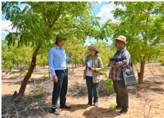
Xoan chịu hạn trồng trên đồi cát thuộc xã Hòa Thắng, huyện Bắc Bình (Bình Thuận) đã phát triển thành rừng.

các xã Chí Công, Bình Thạnh, huyện Tuy Phong và khu Lê Hồng Phong huyện Bắc Bình. Để giảm mức khắc nghiệt của tiểu khí hậu miền cát hoang mạc, tạo thiên nhiên xanh. Từ nguồn ngân sách trung ương và địa phương, UBND tỉnh đã chủ động đề ra các giải pháp kỹ thuật chinh phục cát di động. Ưu tiên đầu tư các dự án lâm nghiệp, làm tăng diện tích rừng phòng hộ nhằm giữ nguồn nước ổn định, chặn đứng nạn cát bay, cố định cồn cát di động và chống xói mòn đất, phục hồi độ phì của đất, tạo ra những thảm xanh cải tạo tiểu khí hậu trong vùng, góp phần ổn định đời sống cho nhân dân.