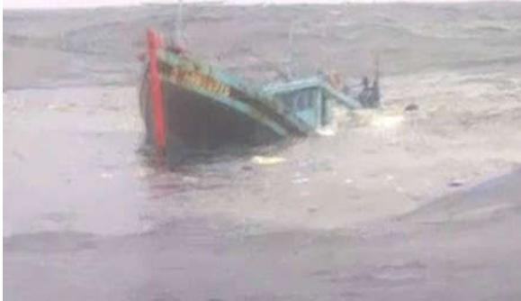
Tàu BTH 98595 TS bị tông vỡ và từ từ chìm xuống biển

vùng biển Trường Sa) cách La Gi khoảng 180 hải lý.