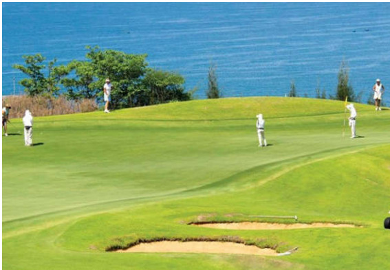
Du khách đến Bình Thuận để tận hưởng kỳ nghỉ tại “thiên đường du lịch”.

B ình Thuận giàu tài nguyên du lịch, với nhiều bãi biển và cát đẹp, đó là điều kiện cần để Bình Thuận sớm điền tên mình vào bản đồ du lịch Việt Nam với tư cách điểm đến hấp dẫn bậc nhất Nam Trung Bộ.