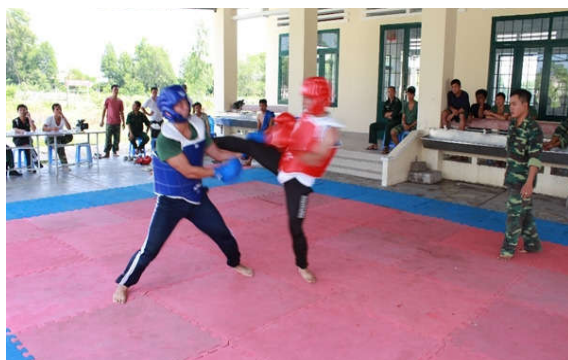
Các VĐV tham gia thi đấu tại Hội thao võ thuật chiến đấu tay không năm 2015.

N gày 7-9, tại Tiểu Đoàn Huấn luyện - Cơ động, BDBP Bình Thuận tổ chức Hội thao võ thuật chiến đấu tay không năm 2015 với sự tham gia của 24 đồng chí là hạt nhân tiêu biểu của các đơn vị BDBP trong toàn tỉnh.