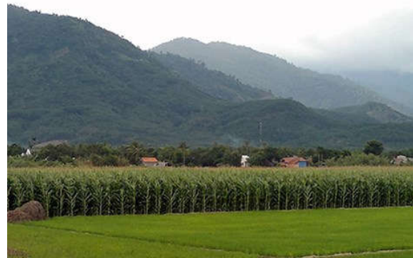
"Làng ung thư" Mê Pu dưới chân núi Tà Púra.