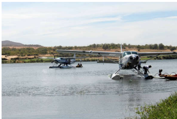
Thủy phi cơ đưa du khách từ Thành phố Hồ Chí Minh tới Bình Thuận đáp xuống hồ Bàu Trắng.