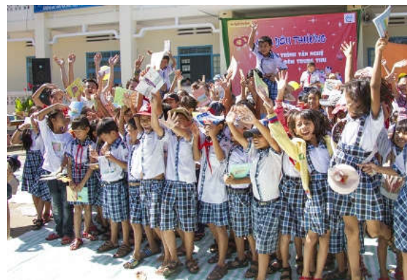
Nụ cười hạnh phúc của các em thiếu nhi.

Vào sáng 27/9 (tức ngày 15/8 Âm lịch), Đội thiện nguyện “Mùa yêu thương” đã tiến hành chương trình văn nghệ mang tên “Điều ước đêm Trung thu”.