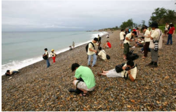
Du khách tham quan bãi đá bảy màu Cổ Thạch.

Nằm trên mảnh đất Bình Thuận nhiều nắng gió, Cổ Thạch là cái tên chưa quá phổ biến trên bản đồ du lịch Việt Nam vì nằm ở huyện Tuy Phong - điểm giáp ranh giữa hai tỉnh Bình Thuận - Ninh Thuận, dễ bị lướt qua trên hành trình di chuyển. Tuy nhiên, đây là nơi sở hữu vẻ đẹp kỳ vĩ, hoang sơ, đặc biệt hấp dẫn các tay máy thích “săn” ảnh hay những người ưa du lịch khám phá. Từ thành phố Hồ Chí Minh, xuôi theo quốc lộ 1, tới ngã ba Liên Hương (Tuy Phong) rồi rẽ phải, sẽ đến được bãi biển Cổ Thạch, nơi được mệnh danh là “vùng đất ngoài hành tinh” bởi vẫn ẩn chứa vẻ đẹp nguyên sơ, chưa bị khai thác nhiều bởi các dịch vụ du lịch. Bãi biển nằm khuất giữa những vách đá thoai thoải với bờ cát dài, mịn, nước biển trong xanh, thơ mộng, tạo cảm giác tự do, phóng khoáng như được hòa mình cùng thiên nhiên. Dạo quanh bờ biển vài trăm mét, người thường lẫm sẽ bị hút hồn bởi bãi đá hình cánh cung chạy dài ôm lấy biển. Nét hấp dẫn đặc biệt là bãi đá này được tạo hình bởi vô vàn những viên sỏi mang nhiều hình dáng khác nhau như vuông, tròn, tam giác, đa giác... Đáng chú ý, chúng còn được khoác những tấm áo lung linh nhiều màu sắc như vàng, nâu, tím, xanh, lam, đỏ... Mỗi khi ánh nắng chiếu vào, từng viên đá càng lấp lánh ánh sắc. Bãi đá hình thành từ tự nhiên do tác động của thủy triều, hải lưu và nước biển. Thật khó diễn tả cảm giác thư thái, lạ lẫm khi được dạo trên bãi đá sỏi bảy màu bằng chân không.