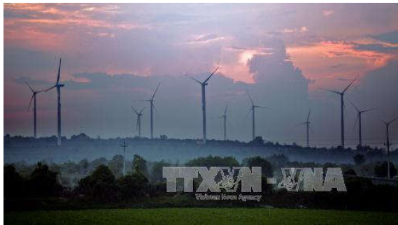
Hệ thống cột phong điện tại huyện Tuy Phong (Bình Thuận).

B ình Thuận là một trong những tỉnh có môi trường đầu tư kinh doanh tốt của Việt Nam và là điểm đến hấp dẫn cho các nhà đầu tư, đặc biệt trong lĩnh vực du lịch và công nghiệp năng lượng. Tại hội nghị "Xúc tiến đầu tư tỉnh Bình Thuận" diễn ra cuối tuần qua, UBND tỉnh Bình Thuận đã ký kết thỏa thuận với các nhà đầu tư của 7 dự án.