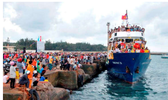
Đông đảo nhân dân huyện đảo Phú Quý tới tham quan và chiêm ngưỡng tàu Hưng Phát 26.

đó, có 109 ghế ngồi, còn lại là giường nằm được bố trí trong 12 phòng và tầng hầm.