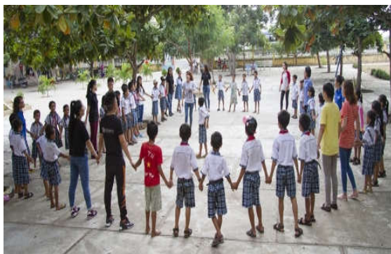
Các tình nguyện viên tổ chức cho các em thiếu nhi vui chơi.

Chương trình được thực hiện bởi Đội thiện nguyện “Mùa yêu thương” đến từ TP.HCM, được tổ chức tại Trường tiểu học Phan Hiệp (huyện Bắc Bình, tỉnh Bình Thuận).