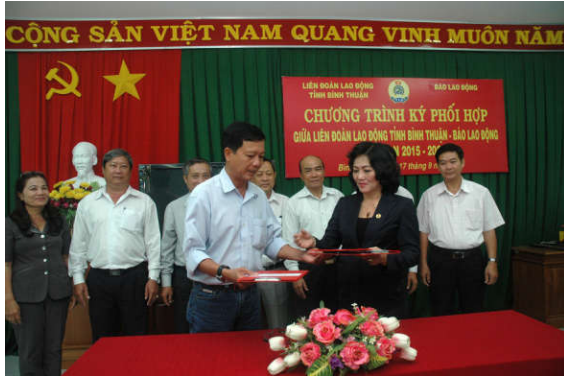
Đại diện LĐLĐ tỉnh Bình Thuận (bên phải) và Báo Lao Động ký kết chương trình phối hợp tuyên truyền giai đoạn 2015 - 2020.

Thực hiện Chỉ thị 01 ngày 6.2.2014 của Tổng LĐLĐVN về “Nâng cao chất lượng hiệu quả hoạt động báo chí, xuất bản của tổ chức công đoàn trong tình hình mới”, ngày 17.9 tại TP. Phan Thiết, LĐLĐ tỉnh Bình Thuận và Báo Lao Động chính thức ký kết chương trình phối hợp tuyên truyền giai đoạn 2015-2020.