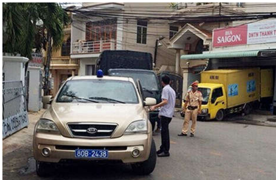
Chiếc xe 80B-2438 có gắn đèn, còi ưu tiên dòm đang bị CSGT kiểm tra.