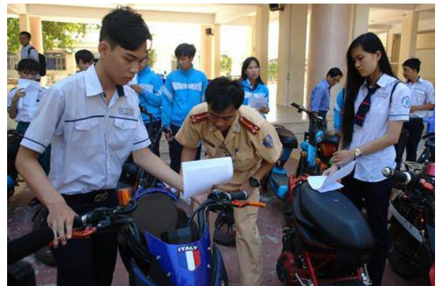
CSGT Bình Thuận đang thực hiện đăng ký xe máy điện, mô tô điện cho học sinh Trường THPT Lê Lợi, TP Phan Thiết

Những học sinh có xe máy điện, mô tô điện được nhà trường tập trung trong một buổi. Các em được phát tờ khai đăng ký cấp biển số với thủ tục đơn giản.