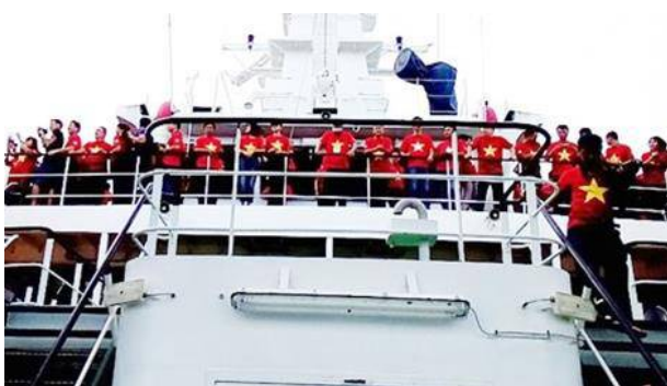
Tàu Cảnh sát biển 8001 chuẩn bị hành trình ra đảo Phú Quý.