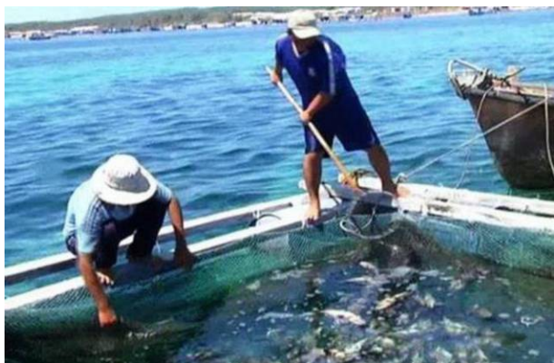
Cá chết tại huyện đảo Phú Quý vào ngày 9-5

trường kiểm tra, xác định rõ nguyên nhân gây ra hiện tượng này, chủ động có biện pháp xử lý ban đầu và có báo cáo, đề xuất hướng xử lý phù hợp.