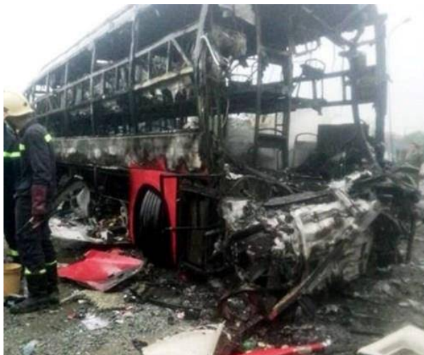
Hiện trường vụ tai nạn đặc biệt nghiêm trọng làm 12 người chết tại Bình Thuận

Ủy ban ATGT Quốc gia cho biết, vào lúc 4h15 ngày 22/5 tại Km 1730+300, quốc lộ 1A thuộc huyện Hàm Thuận Nam, tỉnh Bình Thuận xảy ra vụ TNGT đặc biệt nghiêm trọng giữa 2 xe khách giương năm.