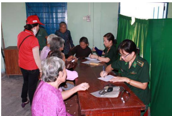
Tổ chức khám bệnh cho bà con.

B iên Phòng - Ngày 16-5, Bộ Chỉ huy BĐBP Bình Thuận phối hợp với Hội chữ thập đỏ tỉnh tổ chức khám bệnh, cấp thuốc và tặng quà cho các gia đình chính