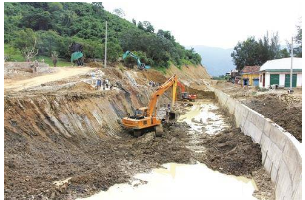
Bình Thuận đang đẩy nhanh tiến độ thi công các công trình thủy lợi để phục vụ cho công tác chống hạn của tỉnh.