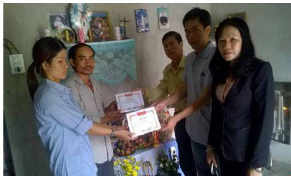
BGH nhà trường công bố kết quả học tập và trao giấy khen cho các em.

Theo quy định đánh giá học sinh tiểu học thì phải thi cuối học kỳ II mới được đánh giá, xếp loại. Theo lịch chỉ còn vài ngày nữa các em sẽ được thi nhưng cả ba em đã mãi mãi rời bỏ cõi đời. Để xoa dịu nỗi đau quá lớn của gia đình, nhà trường đã quyết định “xé rào” và yêu cầu các giáo viên chủ nhiệm đánh giá toàn diện quá trình cả năm học.