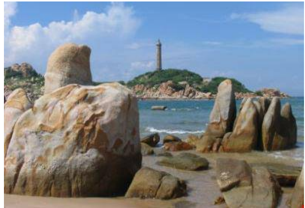
Ngọn Hải đăng Kê Gà đã tồn tại trên 110 năm

thoáng của nền kinh tế thị trường, được người dân Tân Thành đón nhận như một luồng gió mới trong lành. Những nhà đầu tư nhiều nơi cũng được thu hút về và xem nơi đây là vùng đất có nhiều tiềm năng và cơ hội để đầu tư phát triển làm du lịch, khu nghỉ dưỡng.