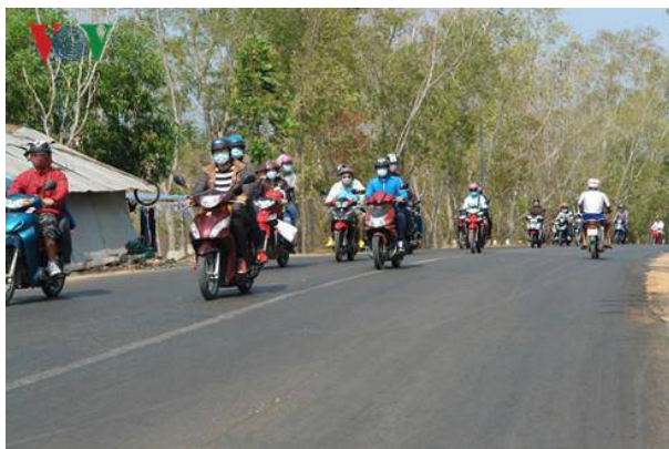
Nhiều bạn trẻ từ các tỉnh phía Nam đi chơi Mũi Né bằng xe máy

Theo ước tính của Sở Văn hóa - Thể thao và Du lịch tỉnh Bình Thuận, trong dịp nghỉ lễ này, toàn tỉnh đón hơn 100.000 lượt khách đến tham quan, nghỉ dưỡng. Phần đông du khách đến Bình Thuận trong dịp này từ các tỉnh thành phía Nam và Tây Nguyên.