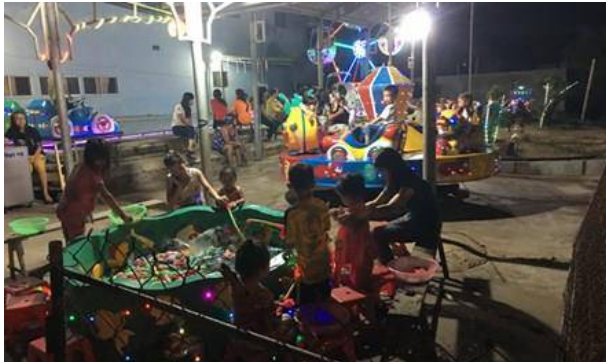
Từ khi có điện 24/24 giờ, khu vui chơi cho trẻ em trên đảo Phú Quý được hình thành.

K ể từ 2014, người dân trên đảo Phú Quý (Bình Thuận) được cung cấp điện 24/24, ngang với giá điện trong đất liền. Nhờ có điện đầy đủ, cuộc sống của người dân Phú Quý đang từng ngày thay đổi, khấm khá.