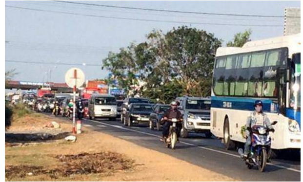
Kẹt xe tại Trạm thu phí Sông Phan hồi tháng 2-2016

hưởng đến lưu thông và gây mất an toàn giao thông cho phương tiện tham gia giao thông.