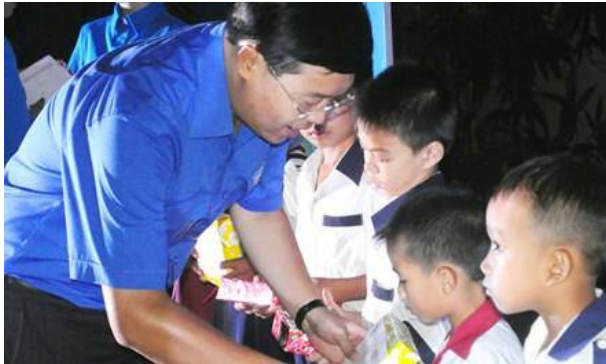
Anh Lê Quốc Phong tặng quà cho học sinh tại đảo Phú Quý.

N gày 16/5, trong chuyến công tác tại huyện đảo Phú Quý (tỉnh Bình Thuận), anh Lê Quốc Phong, Ủy viên dự khuyết T.Ư Đảng, Bí thư thứ nhất T.Ư Đoàn đã đến thăm tiểu đoàn công binh Hải quân 887 (thuộc Lữ đoàn Công binh 83, Quân chủng Hải Quân) và Thăm Trạm ra đũa 575 (thuộc Trung đoàn 451, Vùng 4 Hải quân).