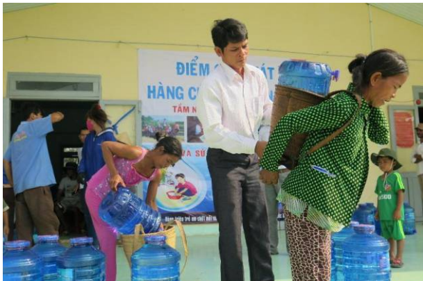
Người dân nhận hỗ trợ từ tổ chức World Vision.

Tổ chức Tầm nhìn Thế giới (World Vision) sẽ hỗ trợ nước sạch, dụng cụ chứa nước, lọc nước với tổng giá trị lên tới gần 60.000 USD cho trẻ em và người dân nghèo ở Bình Thuận - nơi đang hứng chịu những ảnh hưởng nặng nề của đợt hạn hán tồi tệ nhất trong gần một thế kỷ qua.