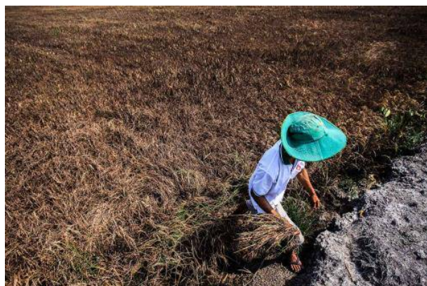
Hạn hán đang tác động tiêu cực tới cuộc sống của người dân Bình Thuận.

Tại kỳ họp thứ 13, khóa IX, Hội đồng Nhân dân tỉnh Bình Thuận đã đề xuất nhiều giải pháp chống hạn trước mắt cũng như khẩn cấp hỗ trợ người dân đang thiếu nước sinh hoạt.