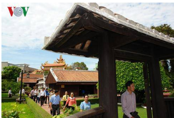
Rất đông người đến thăm di tích Trường Dục Thanh trong ngày 19/5.

Nhân kỷ niệm ngày sinh Chủ tịch Hồ Chí Minh, những ngày này, nhiều người dân tỉnh Bình Thuận và du khách thập phương đã đến thăm Khu di tích Dục Thanh, nơi Bác Hồ từng dạy học trước khi Người ra đi tìm đường cứu nước.