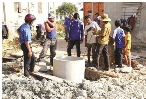
Đồng bào đào giếng tìm nước.

Nguyễn Thanh / Dân tộc và Miền núi.- 2016.- Số tháng 3.- Tr. 6