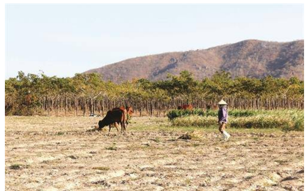
Vườn cây trôm không thể khai thác, đã chuyển sang màu vàng vì thiếu nước.

nước để sản xuất nên đành bắt lức nhìn những luống hành cháy khô trên đồng ruộng”.