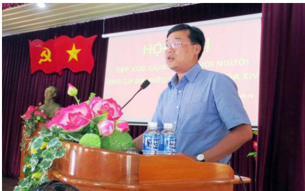
Anh Lê Quốc Phong trúng cử đại biểu Quốc hội khóa XIV tại đơn vị bầu cử số 1 ở Bình Thuận với tỷ lệ phiếu bầu cao nhất

C hiều 26-5, Ủy ban bầu cử tỉnh Bình Thuận đã có báo cáo kết quả bầu cử HĐND các cấp và đại biểu Quốc hội.