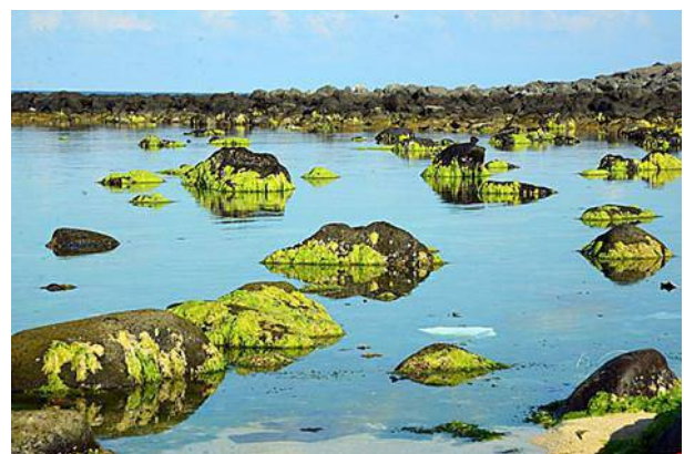
Rong rêu xanh phát triển cực nhanh bám đầy các tảng đá ở bờ biển đảo Phú Quý.