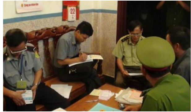
Đoàn Kiểm tra liên ngành đã thu giữ các mẫu thịt khoảng 500 ký và một số heo sống để tiến hành kiểm định, điều tra và xử lý theo quy định của pháp luật.

Salbutamol và yêu cầu chủ cơ sở nuôi nhốt riêng số heo này để xử lý theo quy định của pháp luật.