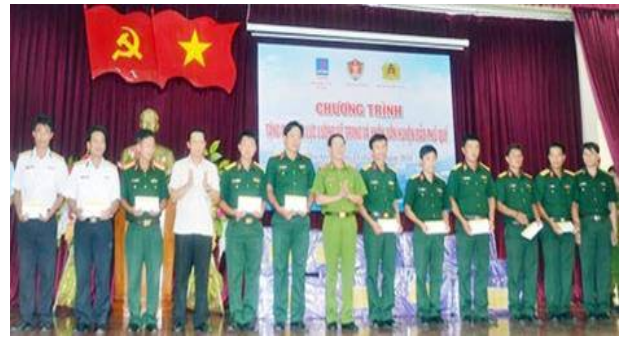
Trung tướng, Anh hùng Phan Văn Vĩnh, Tổng Cục trưởng Tổng cục Cảnh sát (Bộ Công an) tặng quà cho các lực lượng vũ trang trên đảo Phú Quý, Bình Thuận

Chiều 24-5, đoàn công tác đã tổ chức dâng hương tại Bia tưởng niệm liệt sỹ của huyện đảo Phú Quý và tổ chức lễ trao tặng quà cho dân nghèo, học sinh nghèo hiếu học và các đơn vị lực lượng vũ trang trên đảo.