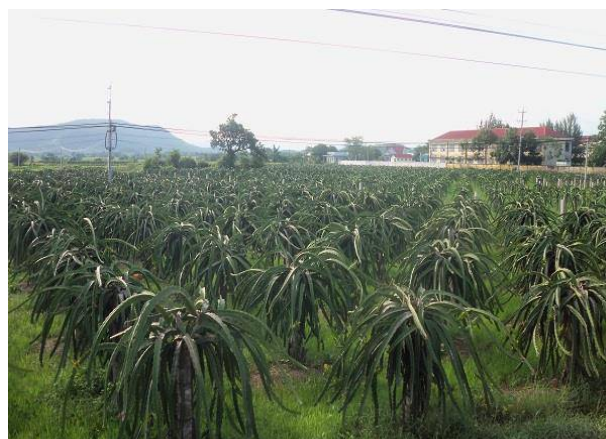
Những cánh đồng thanh long trái dài tít tắp.

Đổi lập với lính ngụy, đời sống người dân ở đây lúc bấy giờ phải chịu sự đàn áp hàng ngày. Ruộng vườn bị lính ngụy chiếm hết, bán buôn thì bị đánh thuế rất cao. Nhân dân theo cách mạng phải nép vào các bìa rừng sinh sống làm ăn. Người dân bị o ép, đàn áp đến tột cùng.