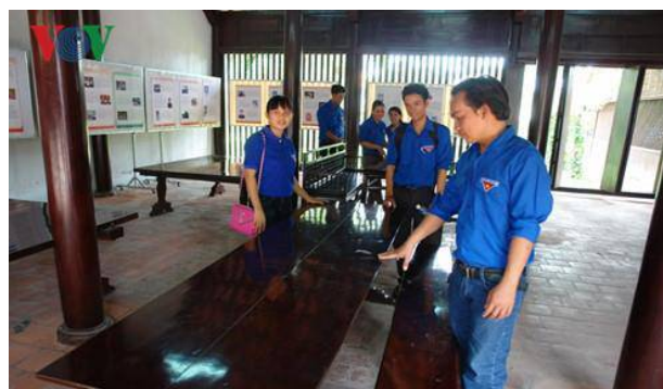
Các bạn thanh niên xem các kỷ vật gắn liền với thời gian Bác dạy học ở Trường Dục Thanh.