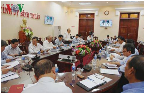
Ủy ban bầu cử tỉnh Bình Thuận tổng rà soát công tác chuẩn bị bầu cử

Đến nay, mọi công tác chuẩn bị cho ngày bầu cử đại biểu Quốc hội khóa XIV và Hội đồng nhân dân các cấp ở tỉnh Bình Thuận cơ bản đã hoàn tất. Đó là khẳng định của Ủy ban bầu cử tỉnh Bình Thuận trong hội nghị tổng kiểm tra công tác bầu cử diễn ra vào sáng nay (17/5).