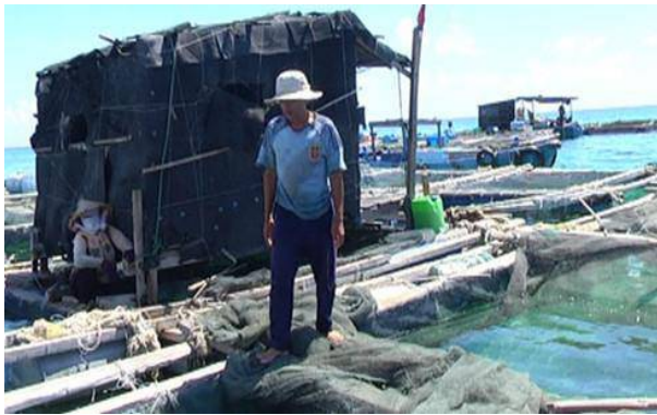
Cần hướng dẫn các chủ bè biện pháp ngăn chặn

trung triển khai ngay các biện pháp ngăn ngừa.