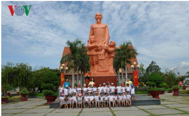
Cô trò chụp ảnh lưu niệm dưới tượng Bác Hồ.

Dịp này, nhiều trường học trên địa bàn tỉnh Bình Thuận cũng tổ chức cho học sinh của trường mình đến thăm di tích Trường Dục Thanh ở thành phố Phan Thiết. Hoạt động ngoại khóa này có ý nghĩa chính trị sâu sắc đối với thế hệ tương lai.