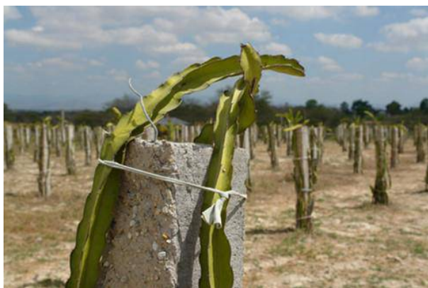
Thanh long ở Bình Thuận đang bị héo khô do thiếu nước tưới.

Thủ phủ thanh long Bình Thuận đang bị ảnh hưởng nặng nề do hạn hán gay gắt. Hàng nghìn ha thanh long chết héo và không thể sản xuất nghịch vụ do thiếu nước. Ngành nông nghiệp địa phương đã khuyến cáo nông dân thực hiện một số biện pháp chống hạn, giảm thiệt hại cho loại cây trồng lợi thế này.