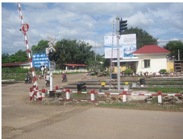
Ga Sông Mao nhân chứng lịch sử mãi còn lưu giữ.

T rước mùa Xuân 1975, khu vực Sông Mao (thuộc Hải Ninh, Bắc Bình, Bình Thuận) được ví như “Sài Gòn Hai”. Vùng đất này được chính quyền ngụy xây dựng để các sỹ quan, binh lính sau mỗi đợt càn quét về đây nghỉ ngơi. Chuối ngày đó đã khép lại sau ngày miền Nam hoàn toàn giải phóng, thống nhất đất nước.