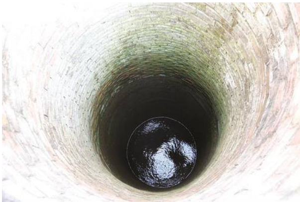
Nhiều giếng nước của đồng bào bị nhiễm mặn không sử dụng được