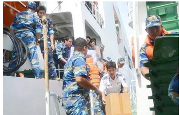
Vận chuyển hàng vào cảng Phú Quý sáng 24-5.