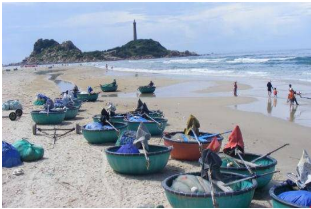
Tân Thành là một vùng đất đầy tiềm năng phát triển

Rồi trong hai mươi một năm kháng chiến chống Mỹ cứu nước, nơi đây chỉ còn là vùng đất chết, bom cày, đạn xới, chất độc khai hoang đã để lại “di chứng” cho đến bây giờ. Chiến tranh đã tàn phá, hủy diệt cây cối hoa màu, ruộng vườn và những công trình mà bao thế hệ tạo lập, bồi đắp.