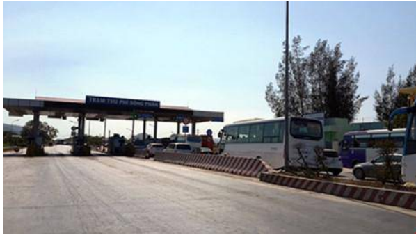
Trạm thu phí Sông Phan

duyet biện pháp khắc phục, sửa chữa đúng chất lượng để đảm bảo an toàn giao thông.