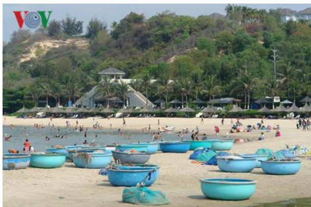
Khách vui chơi, tắm biển tại bãi đá Ông Địa, Phan Thiết

T rong dịp lễ 30/4 và 1/5, các khu du lịch ven biển tỉnh Bình Thuận thu hút rất đông du khách đến tham quan và nghỉ dưỡng.