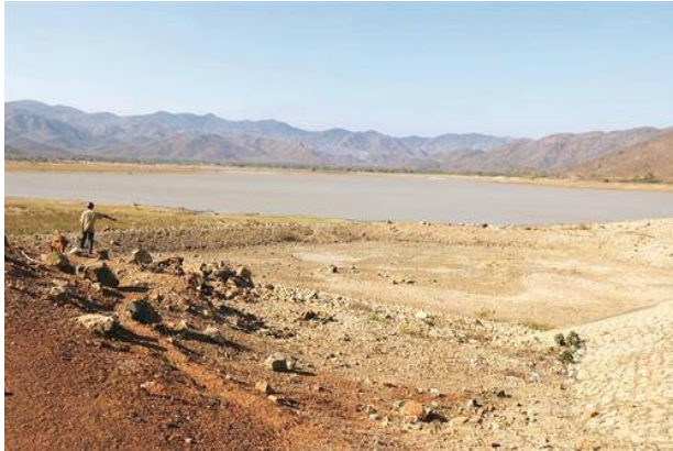
Nhiều hồ chứa nước trên địa bàn tỉnh ở mực nước chết.

Trước tình hình này, Bình Thuận đã chuyển đổi 1.300 ha lúa sang trồng các loại cây ngắn ngày như bắp, rau, đậu... Đồng thời, huy động nhân dân làm thủy lợi và thực hiện các biện pháp tưới nước tiết kiệm. Tuy nhiên, nếu hạn hán kéo dài, khoảng 200 ha mì tại huyện Hàm Tân, 3.000 ha lúa tại huyện Tánh Linh và nhiều diện tích cao su, thanh long, tiêu, điều của tỉnh sẽ bị ảnh hưởng nghiêm trọng.