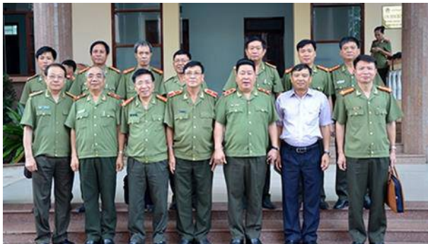
Thứ trưởng Bùi Văn Thành tại buổi làm việc với Công an Bình Thuận.