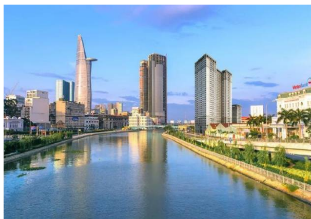
Một góc TP.HCM

B áo Giao thông nêu ý kiến đánh giá của Bí thư Tỉnh ủy Bình Thuận và Bí thư Tỉnh ủy Long An về ảnh hưởng của TP.HCM đến sự phát triển của các tỉnh thành phía Nam.