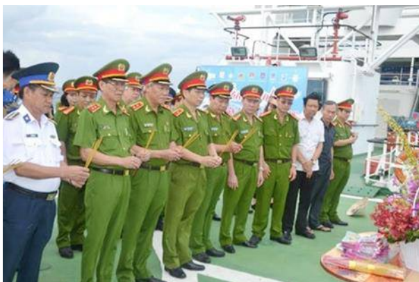
Các đồng chí lãnh đạo Tổng Cục Cảnh sát, BTL Cảnh sát biển Vùng 3 cùng CBCS làm lễ tưởng niệm liệt sỹ hy sinh vì chủ quyền Biển Đảo.

Vượt qua hơn 120 hải lý, 7h sáng 24-5, Tàu Cảnh sát Biển 8001 đã đưa đoàn CBCS Tổng cục Cảnh sát đến khu vực neo đậu ngoài cảng Phú Quý. Đoàn công tác của Tổng cục Cảnh sát đã tổ chức nghi lễ dâng hương để tưởng nhớ những anh hùng, liệt sỹ, các chiến sỹ Hải quân nhân dân, Cảnh sát Biển, Bộ đội Biên phòng đã hy sinh vì sự nghiệp bảo vệ toàn vẹn lãnh thổ và chủ quyền thiêng liêng biển đảo Tổ quốc. Đến 11h20 tàu cập cảng Phú Quý an toàn.