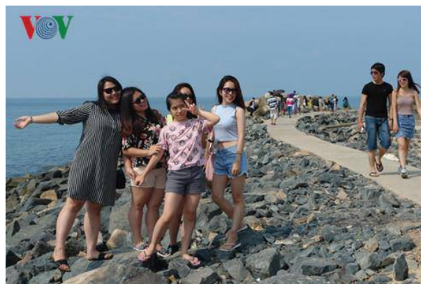
Du khách chụp ảnh tại bãi Đá Ông Địa, Phan Thiết