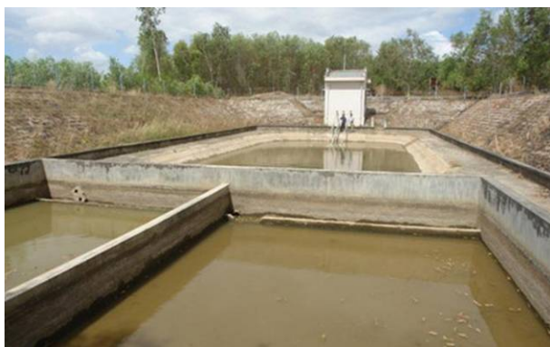
Nhà máy nước Tân Thắng (huyện Hàm Tân, tỉnh Bình Thuận) đã ngưng hoạt động từ ngày 25/2.

U BNĐ tỉnh Bình Thuận chỉ đạo phải triển khai ngay việc khảo sát thiết kế thi công các công trình cấp nước để đảm bảo cấp nước cho các địa phương trong mùa khô năm 2016.