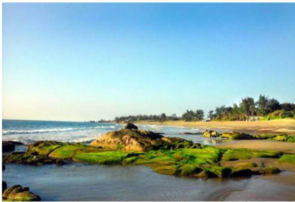
Bãi biển Cổ Thạch luôn hấp dẫn du khách.

B ãi đá Cổ Thạch thuộc huyện Tuy Phong, tỉnh Bình Thuận, cách thành phố Phan Thiết khoảng 100km về phía bắc. Đến đây du khách không chỉ chiêm ngưỡng vẻ đẹp hoang sơ, hùng vĩ của biển, mà còn được ngắm nhìn bãi đá Cổ Thạch đầy màu sắc.