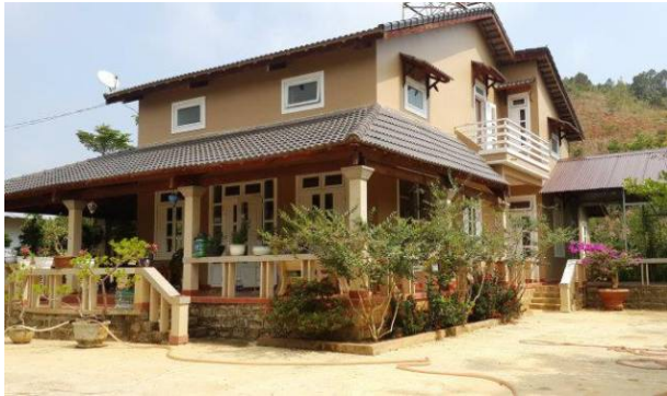
Khu biệt thự trái phép tại tiểu khu 59 do Ban quản lý rừng phòng hộ Cà Giây quản lý

N gày 6-5, chủ tịch UBND tỉnh Bình Thuận đã ký văn bản giao các Sở, đơn vị xác minh vụ xây biệt thự trái phép trong rừng phòng hộ tại tiểu khu 59 thuộc Ban quản lý rừng phòng hộ Cà Giây.