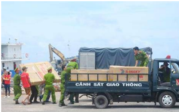
Công an Phú Quý và các lực lượng vũ trang đón nhận hàng hóa, quà tặng và đoàn công tác Tổng Cục Cảnh sát, Bộ Công an