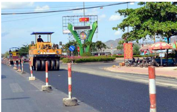
2 điểm xuống cấp nặng nhất ở Bình Thuận đã được Chi nhánh 319- BOT Sông Phan khắc phục.

Hôm nay (20/5) đúng thời hạn cuối Bộ GTVT yêu cầu Tổng công ty 319 hoàn thành việc khắc phục sụt lún trên tuyến Quốc lộ 1 đoạn qua tỉnh Bình Thuận và Đồng Nai dài hơn 114 km. Cục Quản lý đường bộ 4 đã tiến hành kiểm tra việc khắc phục sự cố trên tuyến đường này.