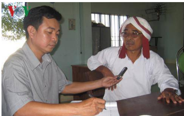
Cử tri người Chăm trả lời phỏng vấn của phóng viên VOV

Bình Thuận là một tỉnh có đông đồng bào Chăm. Cử tri người Chăm nơi đây đều ý thức được trách nhiệm công dân của mình với cuộc bầu cử Đại biểu Quốc hội và Hội đồng Nhân dân các cấp lần này. Ai cũng muốn lựa chọn những người ưu tú, có đức, có tài, có ý thức trách nhiệm, đại diện xứng đáng cho nhân dân vào các cơ quan quyền lực cao nhất ở Trung ương và địa phương.