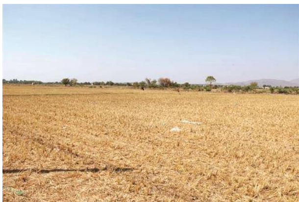
Nhiều diện tích đất canh tác phải bỏ hoang vì không có nước sinh hoạt