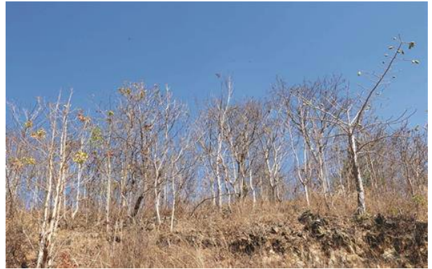
Khoảng 1.400 ha cây trồng bị khô héo vì thiếu nước.