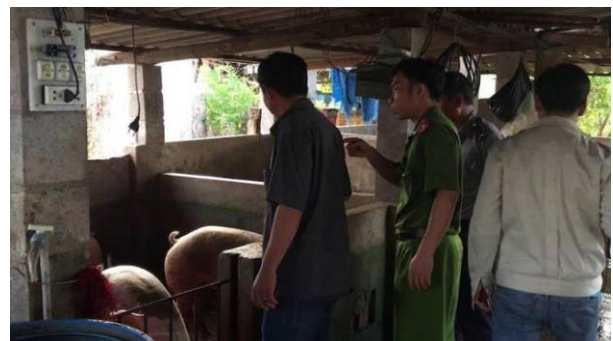
Đoàn kiểm tra đã lập biên bản cơ sở mổ heo.

Thanh, ngày 11/5 cơ sở này vừa mua 12 con heo từ Đồng Nai, đã giết mổ 7 con, còn 5 con trong chuồng.