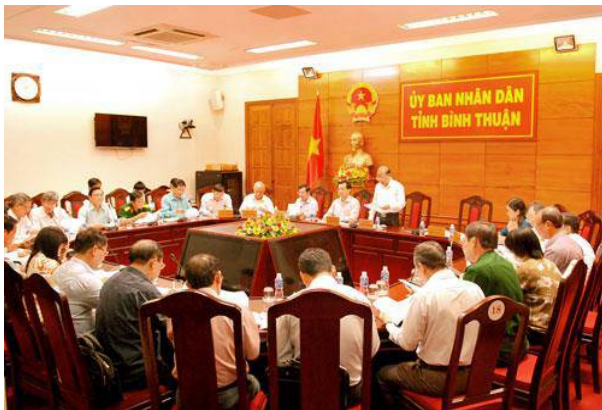
Toàn cảnh cuộc họp.

C hiều 26/5, Ủy ban Bầu cử tỉnh Bình Thuận đã tổ chức cuộc họp nghe Sở Nội vụ, cơ quan thường trực Ủy ban Bầu cử tỉnh, báo cáo kết quả bầu cử đại biểu Quốc hội khóa XIV và đại biểu HĐND các cấp nhiệm kỳ 2016-2021.