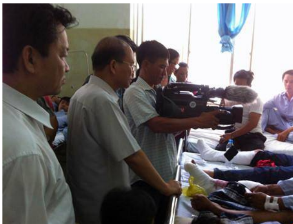
Lãnh đạo tỉnh Bình Thuận đến bệnh viện để thăm hỏi, chia sẻ cùng các nạn nhân vụ tai nạn thảm khốc.