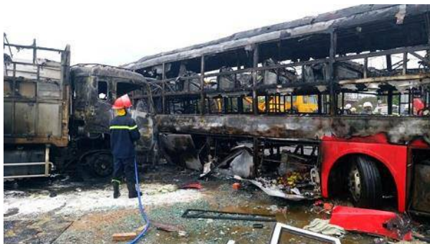
Hiện trường vụ TNGT kinh hoàng tại Bình Thuận.

Sáng 22/5, trả lời phóng viên VTC News, lãnh đạo Phòng CSGT tỉnh Bình Thuận cho biết, đơn vị thống kê ban đầu có 12 người chết và nhiều người bị thương đang được cấp cứu rải rác tại các bệnh viện trên địa bàn huyện, tỉnh sau vụ tai nạn kinh hoàng vào sáng cùng ngày.