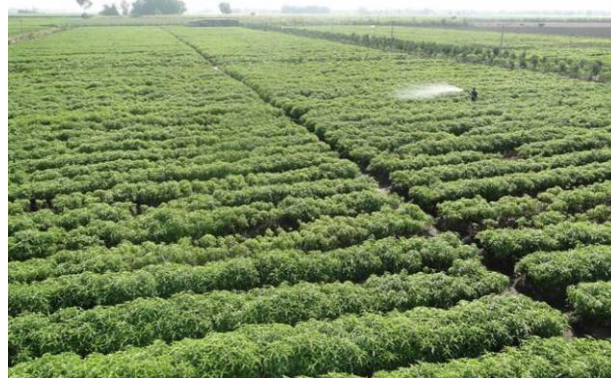
Cây hoàn ngọc được trồng quy mô theo tiêu chuẩn thế giới tại Tây Ninh

Nói về quá trình “gặp gỡ”, sử dụng nước từ cây hoàn ngọc, anh Hy bộc bạch: “Loại nước hoàn ngọc tôi đang dùng được chế biến từ rễ và lá cây. Trong cây này, các nhà khoa học phát hiện có nhiều axit amin cần thiết cho các chuyển hóa của cơ thể. Mẫu chiết xuất từ rễ cây hoàn ngọc 7 năm tuổi được trồng và chăm sóc tại Tây Ninh phát hiện chứa nhiều chất quý như: Lupeol, Lupenone, Bentulin, axit Pomolic... có tác dụng: kháng viêm, chống oxy hoá, gây độc tế bào ung thư”.