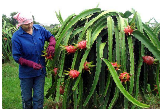
Huyện Hàm Thuận Nam có nhiều diện tích cây trồng bón phân Vắn Điện.

các chất trung và vi lượng khác rất cần cho các vùng trồng thanh long tập trung chuyên canh vì qua nhiều năm bón nhiều phân đạm, phun thuốc BVTV, các chất độc hại tồn dư trong đất ngày càng nhiều, khiến sâu bệnh tăng lên, nhất là bệnh đốm trắng. Các chất có trong phân bón Vắn Điện, nhất là Si (Silic) đã góp phần khử, trung hoà chất độc hại, diệt mầm bệnh và giúp cây thanh long nói riêng, cây trồng nói chung tăng khả năng chịu hạn.