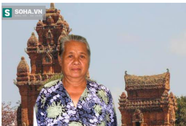
Vương miện bằng vàng của vua và hoàng hậu Chăm do gia đình bà Đào cất giữ

Được kế thừa cả một kho báu khổng lồ gồm những báu vật bằng vàng ròng cùng những cổ vật vô giá nhưng công