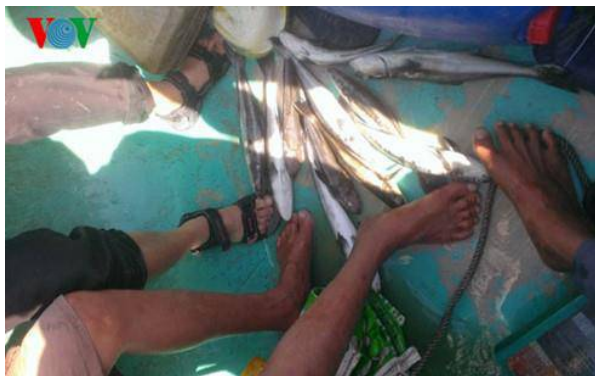
Cá bớp chết vào cuối tháng 12/2015

Kết quả kiểm tra phải báo cáo UBND tỉnh trước ngày 20-1.