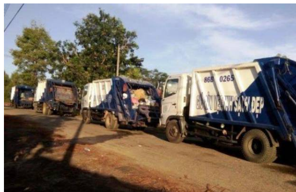
Đoàn xe chở rác bị người dân chặn lại vào cuối tháng 12-2015

với người dân địa phương và hứa với bà con sẽ đáp ứng những nguyện vọng trên để người dân yên tâm sinh sống.