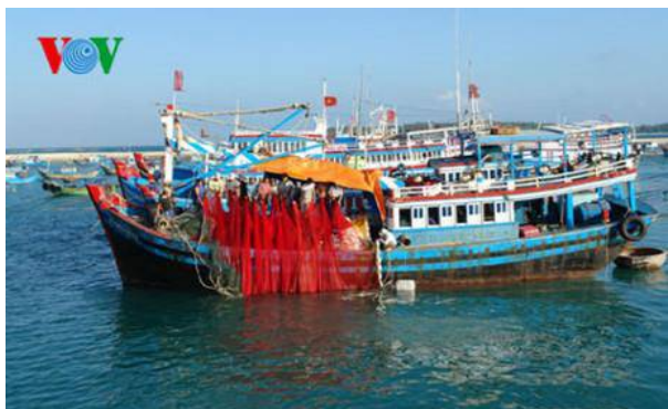
Một tàu cá vừa hoàn thành chuyến đánh bắt trở về đảo Phú Quý

Với con tàu 350CV, ngư dân Tạ Văn Sang ở xã Long Hải, huyện đảo Phú Quý cũng đánh bắt ở vùng biển Trường Sa và Nhà giàn DK1. Hầu hết các chuyến biển của anh đều thuận lợi và đạt sản lượng khá. Cá bán được với giá cao, trong khi đó giá dầu diesel từ trên 20.000 đồng giảm xuống còn từ 13.000 đến 16.000 đồng/lít, nên hiệu quả kinh tế mang lại cho mỗi chuyến đánh bắt khá cao. Lợi nhuận mang về trong năm qua được gần 500 triệu đồng.