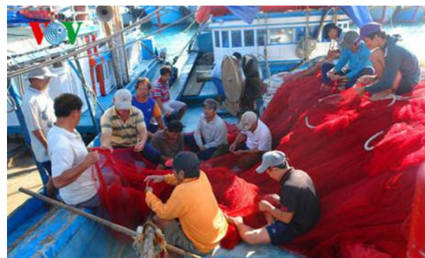
Các ngư dân đảo Phú Quý vá lưới sau chuyến đánh bắt hải sản