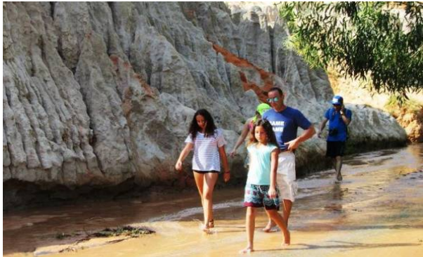
Du khách quốc tế an tâm nghỉ dưỡng và giải trí

D ự báo sẽ có nhiều khách đến Phan Thiết - Bình Thuận tham quan và nghỉ ngơi dịp Giáng sinh và Năm mới 2016, ngay từ đầu tháng 12/2015, tỉnh Bình Thuận đã triển khai nhiều giải pháp quyết liệt để luôn khẳng định hình ảnh điểm đến an toàn và thân thiện để chào đón du khách.