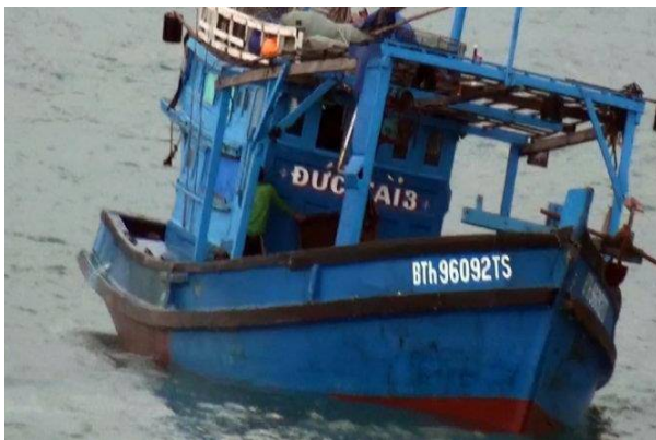
Tàu cá BTh 96092 lúc gặp nạn trên biển

Sáng 2-1, tàu Cảnh sát biển 2010 (Bộ Tư lệnh Vùng Cảnh sát biển 3) đã lai dắt tàu BTH 96092 TS về đến cảng cá Bình Thuận an toàn và bàn giao cho Bộ đội biên phòng tỉnh.