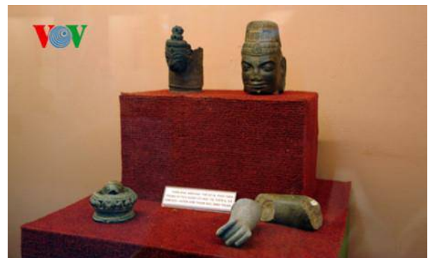
Tượng thần Siva người Chăm thế kỷ thứ IX được phát hiện tại xã Hàm Đức.

cổ học Đa Kai 3.000 năm, tiếp theo đó là nền văn hóa khảo cổ học Sa Huỳnh.)