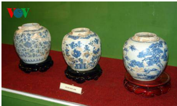
Đồ sứ hoa lam tại khu trưng bày cổ vật tàu đắm.

L ần đầu tiên Bảo tàng tỉnh Bình Thuận giới thiệu đến công chúng các bộ sưu tập hơn 1.000 cổ vật quý hiếm.