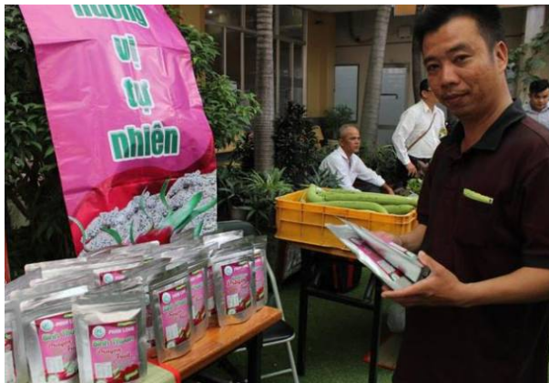
Sản phẩm thanh long sấy khô của HTX Phan Long chuẩn bị được xuất khẩu sang thị trường Hàn Quốc.

HTX Phan Long (TP. Phan Thiết, tỉnh Bình Thuận) đang chuẩn bị xuất khẩu lô hàng thanh long sấy khô đầu tiên sang thị trường Hàn Quốc.