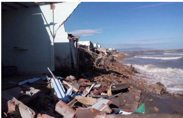
Hoang tàn chỉ sau 1 đêm

H ai ngày gần đây do triều cường dâng cao cộng với gió mùa Đông Bắc thổi mạnh đã gây sạt lở bờ biển nghiêm trọng tại các huyện Tuy Phong và TP Phan