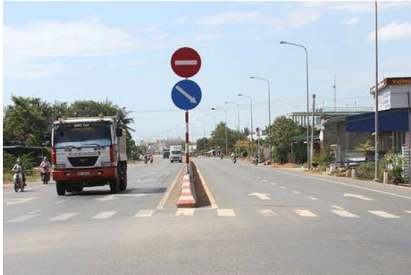
Một đoạn QL1 qua Bình Thuận