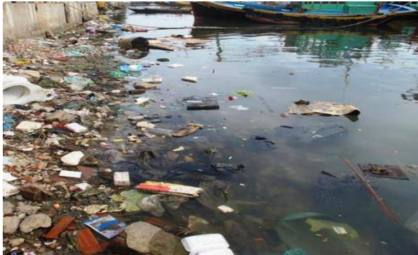
Sông Cà Ty, đoạn chảy qua TP Phan Thiết hiện đang bị ô nhiễm nặng.

ngày càng ô nhiễm nặng nề. Cứ vào khoảng 2-3 giờ hoặc khi thủy triều rút, mùi hôi thối bốc lên nồng nặc. Cũng vì ô nhiễm nên vào mùa mưa muối xuất hiện nhiều, khiến lượng người bị sốt xuất huyết gia tăng. Không chỉ các hộ dân tại phường Đức Thắng mà các hộ dân sống dọc theo dòng sông chảy qua các phường: Phú Trinh, Bình Hưng, Đức Long thuộc TP Phan Thiết, dài hơn 4,5km cũng đều trong tình trạng bị ô nhiễm tương tự”.