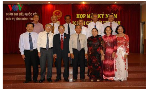
Đại biểu Quốc hội đơn vị tỉnh Bình Thuận qua các thời kỳ.

tỉnh Bình Thuận khóa XIII vừa rồi đã tổ chức cho từng đại biểu đến từng xã, phường, thị trấn tiếp xúc cử tri. Làm được việc đó đã tạo điều kiện cho các đại biểu được gắn bó trực tiếp với cử tri, bởi từng đại biểu tác nghiệp tại từng xã, nên chúng tôi có nhiều thông tin ở từng xã khác nhau.”