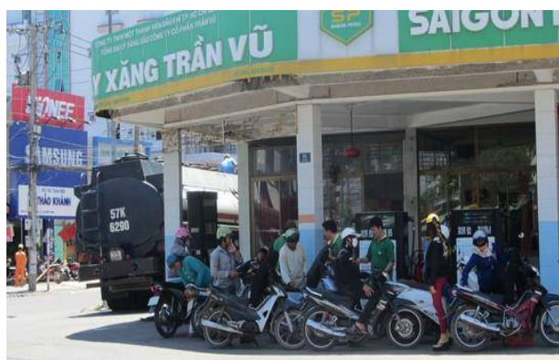
Cửa hàng xăng dầu Trần Vũ bị phạt và thu hồi số tiền thu lợi bất chính gần 40 triệu đồng.

Qua kiểm tra phát hiện 16 cơ sở vi phạm (08 cơ sở vi phạm Luật Đo lường, 08 cơ sở vi phạm Luật Chất lượng sản phẩm hàng hóa), đề nghị xử phạt hành chính với tổng số tiền 224.222.987 đồng.