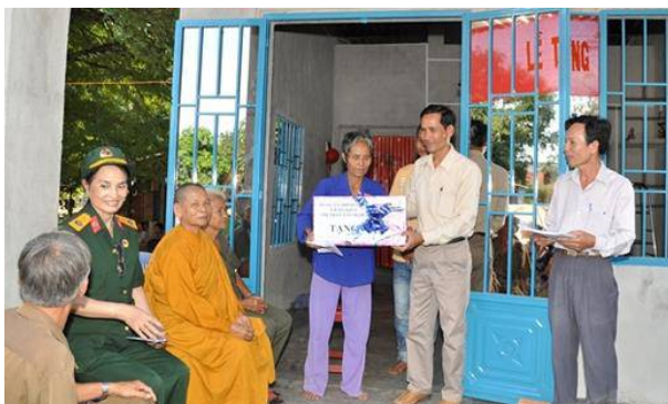
Trao nhà Đại đoàn kết ở Bình Thuận.

Năm 2015, Ban vận động Quỹ “Vi người nghèo” huyện Đức Linh đã đề ra kế hoạch phấn đấu vận động 700 triệu đồng vào Quỹ “Vi người nghèo” và thực hiện các chương trình an sinh xã hội.