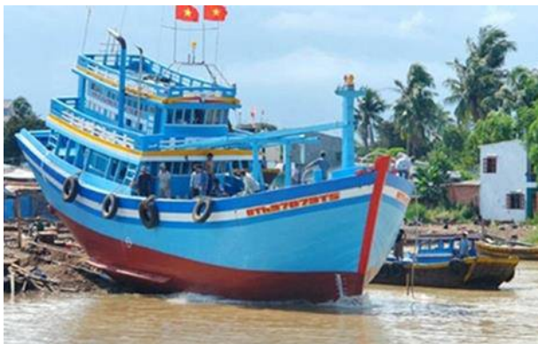
Tàu cá Bình Thuận đóng mới theo Nghị định 67 hạ thủy ra khơi.