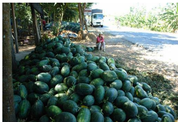
Nông dân thất thu do dưa mất giá.

Tết cho gia đình, vậy mà giá dưa rẻ như cho đang khiến họ điêu đứng.