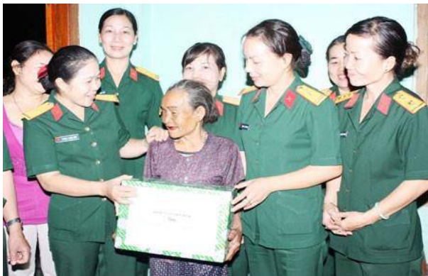
Đại diện Hội Phụ nữ Bộ CHQS tỉnh Bình Thuận và Ban Phụ nữ Quân khu 7 thăm, tặng quà gia đình chính sách trên địa bàn.