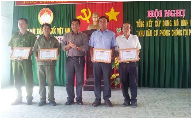
Tuyên dương các mô hình điểm về “Khu dân cư phòng, chống tội phạm” tại Tân Nghĩa - Hàm Tân (Bình Thuận).

Nhìn lại 2 cuộc vận động “Toàn dân đoàn kết xây dựng đời sống văn hóa ở khu dân cư” và cuộc vận động “Ngày vì người nghèo”- tiền thân của Cuộc vận động Toàn dân đoàn kết xây dựng nông thôn mới, đô thị văn minh và Chương trình an sinh phúc lợi xã hội tại Bình Thuận đã đạt được những kết quả đáng ghi nhận.