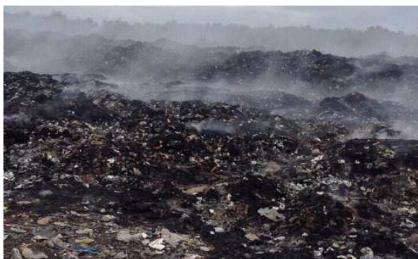
Bãi rác lộ thiên gây ô nhiễm môi trường

UBND thị xã La Gi tỉnh Bình Thuận cho biết đã chấp thuận phương án di dời bãi rác tập trung tại xã Tân Phước theo đề nghị của người dân địa phương.