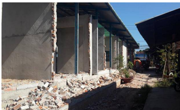
Người dân yêu cầu đập bỏ các kiốt xây bên trong chợ Đức Chính, tuy nhiên đến nay xã chỉ mới đập các bức tường kiốt quay lưng về phía nhà dân - Ảnh: Ng.Nam

Nội dung và quy mô đầu tư xây dựng chợ Đức Chính gồm nhà lồng chợ (nhà trệt, kết cấu thép, tổng diện tích xây dựng 360m 2 ), nhà vệ sinh (nhà cấp 4, diện tích 3,91m 2 ), hệ thống rãnh thoát nước tổng chiều dài 106m, hệ thống chống sét và phòng cháy chữa cháy. Tổng mức đầu tư xây dựng chợ trên 686 triệu đồng, trong đó vốn ngân sách nhà nước hỗ trợ 170 triệu đồng từ trái phiếu chính phủ đầu tư xây dựng nông thôn mới, còn lại huy động của các hộ tiểu thương.