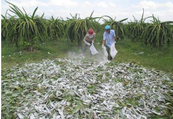
Vệ sinh vườn và xử lý cành, trái bệnh

biết, đến cuối năm 2015, diện tích thanh long nhiễm bệnh đốm nâu trên địa bàn là 1.675 ha, trong đó nhiễm nhẹ 1.600 ha, nhiễm trung bình 75 ha và không có diện tích nhiễm nặng. So với cùng kỳ năm 2014 diện tích nhiễm bệnh đốm nâu đã giảm 3.073 ha.