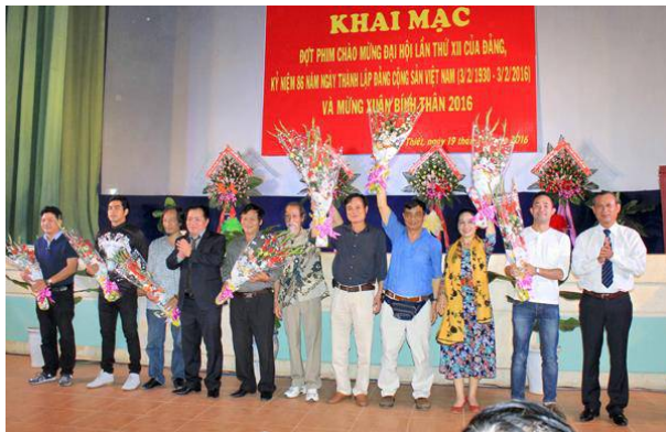
Đoàn phim “Trên đỉnh bình yên” ra mắt khán giả tại Rạp 19-4, TP Phan Thiết (Bình Thuận).

Hai bộ phim “Trên đỉnh bình yên” do Công ty cổ phần phim Truyện I sản xuất và “Đất nước đổi mới” do Công ty TNHH Hãng phim Tài liệu và Khoa học Trung ương sản xuất đã được trình chiếu ngay sau lễ khai mạc tại Rạp 19-4, TP Phan Thiết.