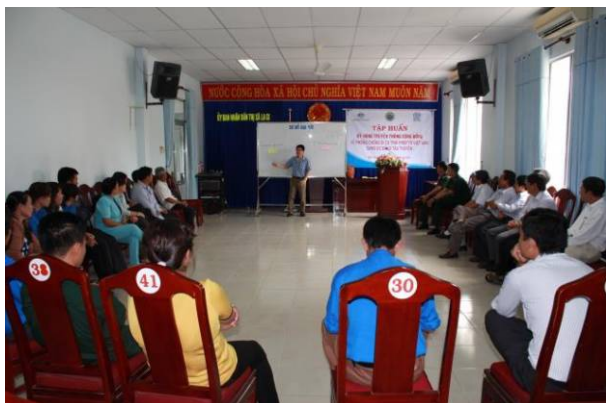
Các học viên đang nghe giảng viên của IOM trình bày các nội dung.

T rong hai ngày 18 và 19-1, Bộ Chỉ huy BDBP tỉnh Bình Thuận phối hợp với Tổ chức Di cư Quốc tế (IOM) tại Việt Nam tổ chức Lớp tập huấn kỹ năng truyền thông cộng đồng về phòng chống di cư trái phép từ Việt Nam sang Ô-xtrây-li-a bằng tàu thuyền tại thị xã La Gi. Tham gia lớp tập huấn có 30 học viên là cán bộ của các phường, xã, các cơ quan đoàn thể của thị xã La Gi và Đoàn BP Phước Lộc.