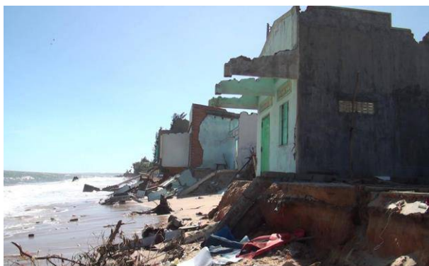
Hàng chục căn nhà bị cuốn trôi xuống biển

Chính quyền địa phương đã huy động lực lượng, vật tư cùng người dân trong khu vực di dời tài sản, sơ tán dân và hỗ trợ làm kè tạm bằng bao cát, dây, cọc, bạt để chống đỡ, hạn chế phần nào nguy cơ tiếp tục sạt lở. Các hộ dân bị sập nhà được bố trí nơi ở tạm, hoặc che tạm chòi ở khu vực gần đó để sinh hoạt và bảo quản tài sản.