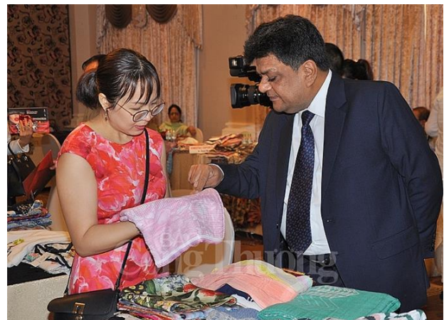
Doanh nghiệp Ấn Độ trưng bày và giới thiệu những bộ sưu tập đẹp, mới nhất làm từ chất liệu tơ lụa với đối tác Việt Nam

Thông qua buổi giao lưu, Tổng Lãnh sự quán Ấn Độ muốn tạo cầu nối giao thương giữa DN hai nước, qua đó thúc đẩy hợp tác kinh doanh và phát triển ngành dệt may Việt Nam - Ấn Độ.