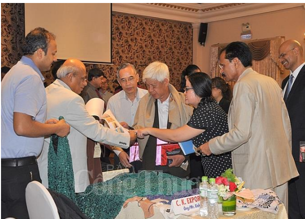
Các doanh nghiệp ngành dệt may Ấn Độ - Việt Nam tại buổi Giao lưu thương mại ngành tơ lụa Ấn Độ

Thông tin được các DN ngành dệt may Ấn Độ cho biết trong buổi Giao lưu thương mại ngành tơ lụa Ấn Độ với các DN Việt Nam, do Tổng Lãnh sự quán Ấn Độ phối hợp với Hội Đồng xúc tiến xuất khẩu tơ lụa Ấn Độ (ISEPC) tổ chức sáng 21/5, tại TP. Hồ Chí Minh.