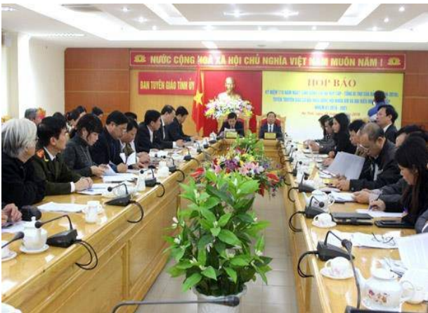
Quang cảnh buổi họp báo.

Sáng 16/3, Ban tuyên giáo Tỉnh ủy Hà Tĩnh tổ chức buổi họp báo nhằm thông tin những hoạt động xung quanh lễ kỷ niệm 110 năm ngày sinh đồng chí Hà Huy Tập - Tổng Bí thư (TBT) của Đảng (1906-2016).