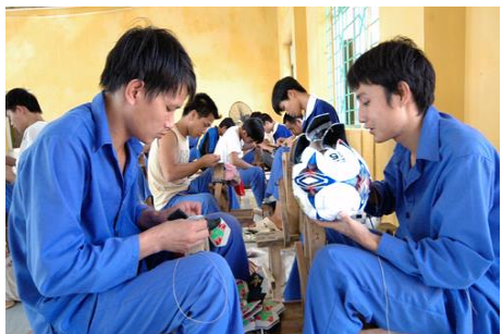
Dạy nghề, tạo việc làm là một giải pháp trị liệu cho học viên cai nghiện.

Phiên họp diễn ra sau khi TP Hồ Chí Minh đã có những kiến nghị về giải quyết những khúc mắc trong hoạt động này. Báo Công an nhân dân cũng đã thực hiện một số chuyên đề liên quan đến những bất cập trong công tác quản lý người nghiện hiện nay, dẫn đến những lo ngại của người dân về tình hình an ninh, trật tự trên các địa bàn. Được biết, Ủy ban Thường vụ Quốc hội cũng đã yêu cầu Chính phủ có hướng xử lý sự việc trước ngày 6/11 tới.