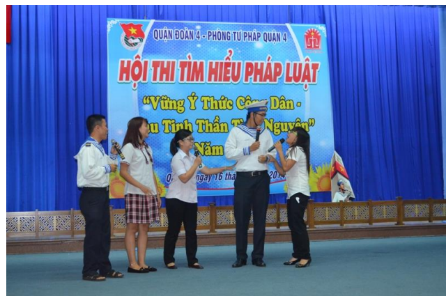
Đoàn viên, thanh niên hào hứng với Ngày Pháp luật

dục cán bộ chiến sĩ những nội dung cơ bản của Hiến pháp nước Cộng hòa xã hội chủ nghĩa Việt Nam năm 2013; thảo luận, giải đáp những vấn đề về pháp luật mà cán bộ chiến sĩ chưa nắm vững nhằm nâng cao nhận thức, phát huy trách nhiệm của cán bộ, chiến sĩ trong việc thực hiện “Sống và làm việc theo Hiến pháp”, tạo sự chuyển biến vững chắc về ý thức chấp hành pháp luật Nhà nước, kỷ luật quân đội, góp phần ngăn ngừa, không để xảy ra vi phạm kỷ luật, pháp luật trong lực lượng vũ trang huyện.